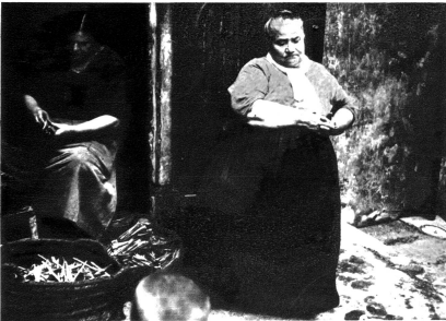
Die Holz- und Kohlhändlerin. Sie schreit nicht wie die vielen Marktfrauen. Sie sitzt gemütlich vor ihrem kleinen Geschäft und döst