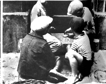
Mit Karten spielen bereits diese Fischerbuben um Kupferpfennig