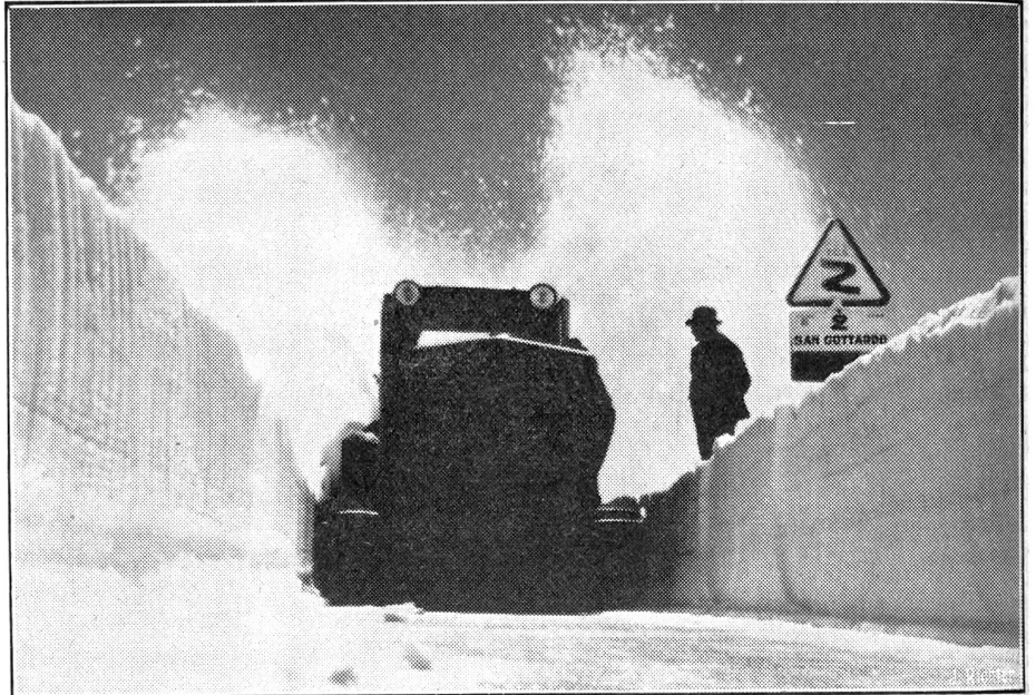
Rekordleistung auf dem St. Gotthard

Auf der Gotthardstrasse von Andermatt nach Airolo werden zur Zeit zur Aufnahme des durchgehenden Strassenverkehrs Schneeräumungsarbeiten vorgenommen. Nachdem letztes Frühjahr zur Ausführung dieser Arbeit eine „Peter“-Schneesleuder mit Erfolg verwendet wurde, zog man zur diesjährigen Schneedurchbruch-Arbeit wieder eine solche zu Hilfe. — Die 150 PS starke „Peter“-Schneefräse (diese wird in der Schweiz, nach eigenen Patenten von der Firma Peter A.-G. in Liestal hergestellt) in voller Tätigkeit auf der St. Gotthard-Passhöhe. Die Maschine schneidet einen 2,5 m breiten Kanal durch Schneemassen bis zu 8 m Höhe.