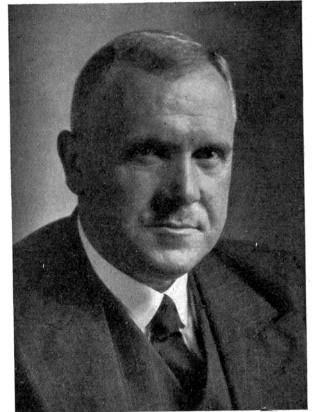
Regierungsratspräsident des Kantons Bern Joss