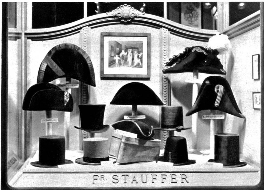
Hüte, wie man sie in Bern vor 150 Jahren trug