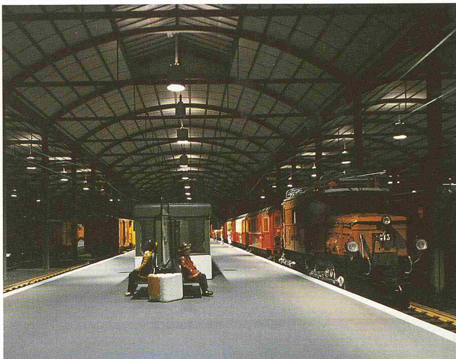
Bild 3. Beleuchtungsversuch am Modell

Zur Erreichung der angestrebten Lichtverteilung könnten auch bisherige Be-