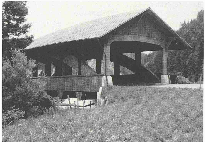
Bild 2. Strassenbrücke in Eggiwil

bringen. Hochbeanspruchte Enddiagonalen von Fachwerken beispielsweise müssen folglich nicht mehr in übergrossen Querschnitten oder sogar in Stahl ausgeführt werden, sondern lassen sich schlanker und konstruktiv einfacher in Brettschichtholz aus Buche ausbilden.