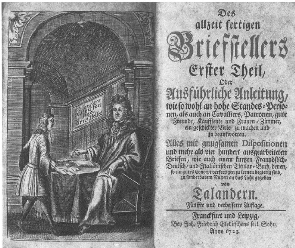
Abb. 2: Titelblatt und Tit elkupfer des «Allzeit fertigen Briefstellers», des ersten 1692 als «Briefsteller» veröffentlichten deutschen Brieflehrbuchs. Hierbei handelt es sich auch um eines der ersten brieftheoretischen Werke, die das Schreiben von Briefen an «Frauen-Zimmer» explizit thematisierten.

weiterführende Untersuchungen, welche die in den Briefstellern abgedruckten Vorlagen hinsichtlich der Korrespondenzpaare und Inhalte mit realen Briefkorpora systematisch vergleichen.