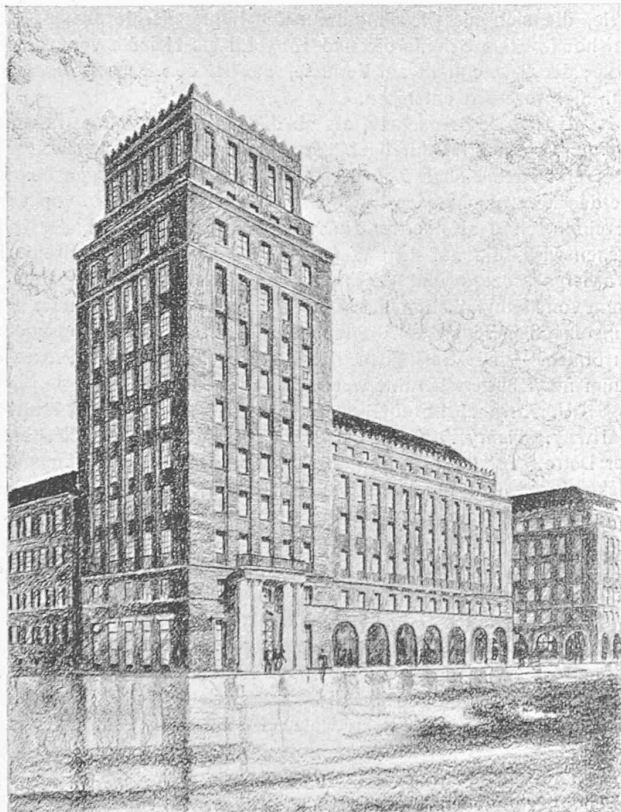
Entwurf Nr. 4. — Norddecke des neuen Bahnhofplatzes.