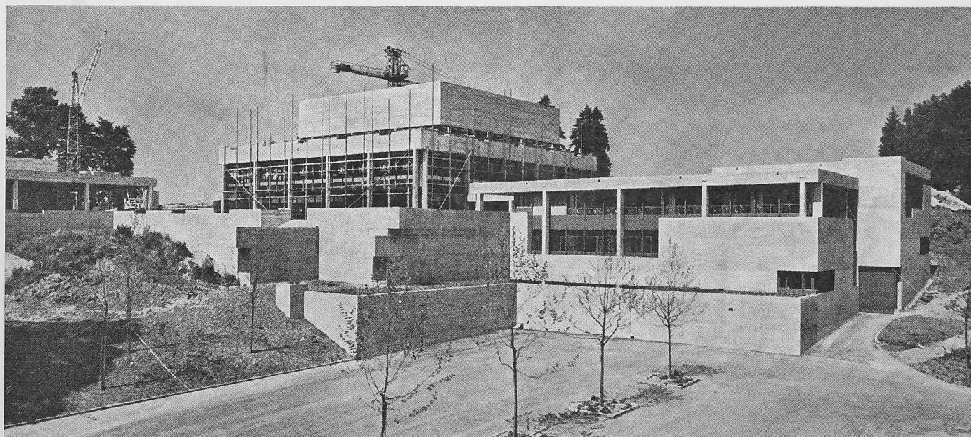
Handelshochschul-Neubau in St. Gallen. Hauptbau, rechts davor Technologie, links Aula. Bauzustand Juli 1962

Für die Finanzierung dieses künstlerischen Planes stehen nur in einem sehr geringen Umfange öffentliche Mittel zur Verfügung. Ein erheblicher Teil des erforderlichen Be-