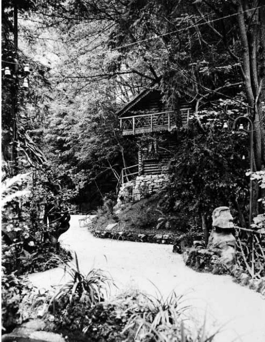
Gartenpartie mit «Schweizerhäuschen», 1907 (Wehrli No. B. 14811)