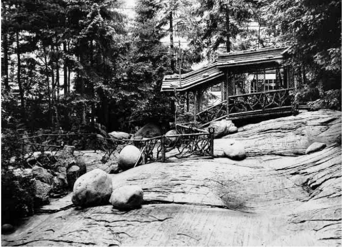
Gletscherschliff mit Findlingen, 1906 (Wehrl No. B. 11766)