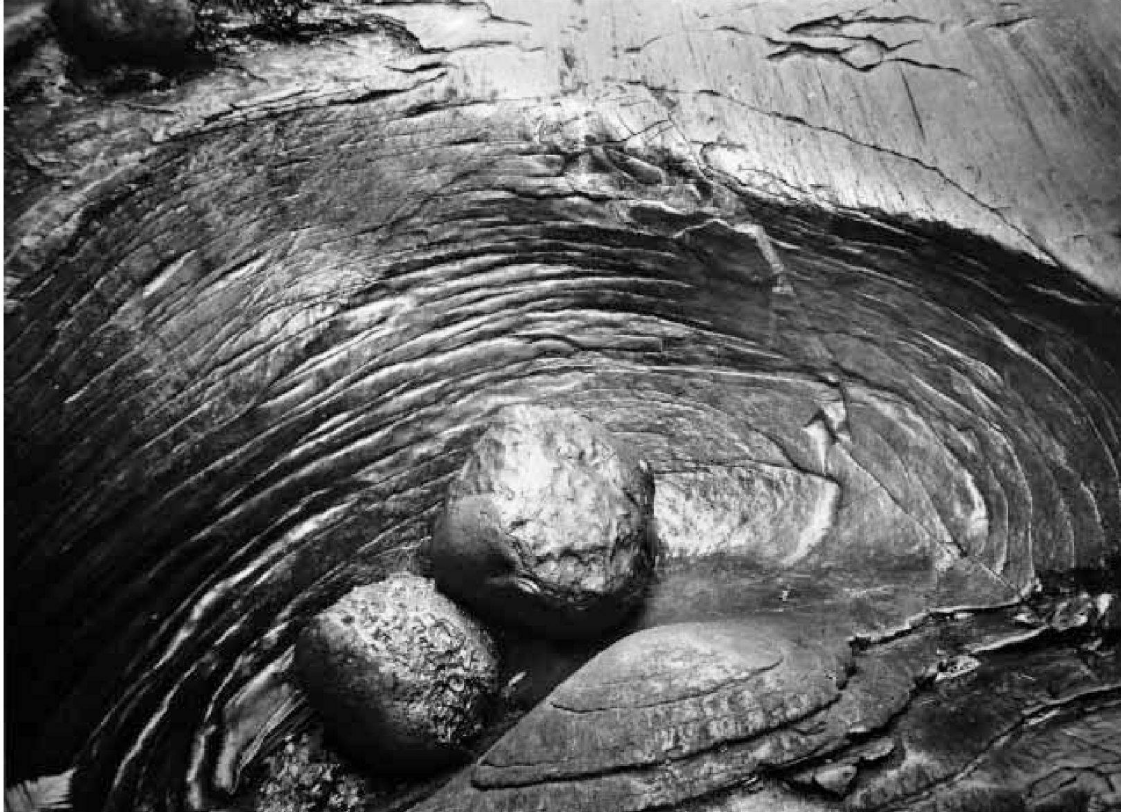
Gletschertopf mit zwei Findlingen, nach 1930 (Photoglob No. A. 2336)