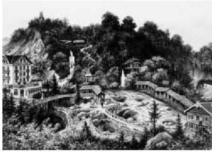
Ansicht des Gletschergartens mit Löwendenkmal, 1906 (Wehrli No. B. 17099)