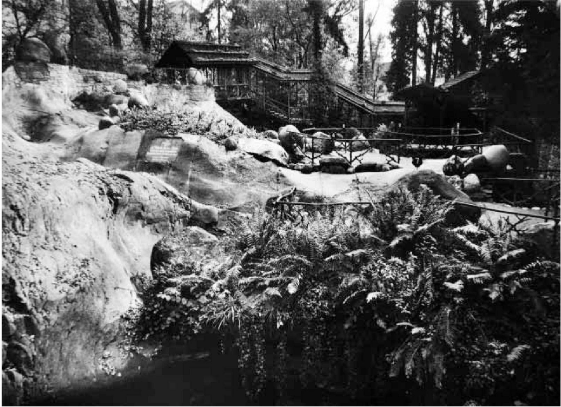
Gletschertöpfe und Findlinge, nach 1930