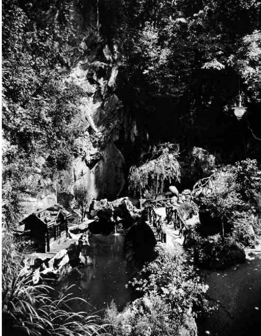
Gestaltete Gartenpartie am Aufstieg zum Aussichtsturm, 1907 (Wehrli No. B. 14796)