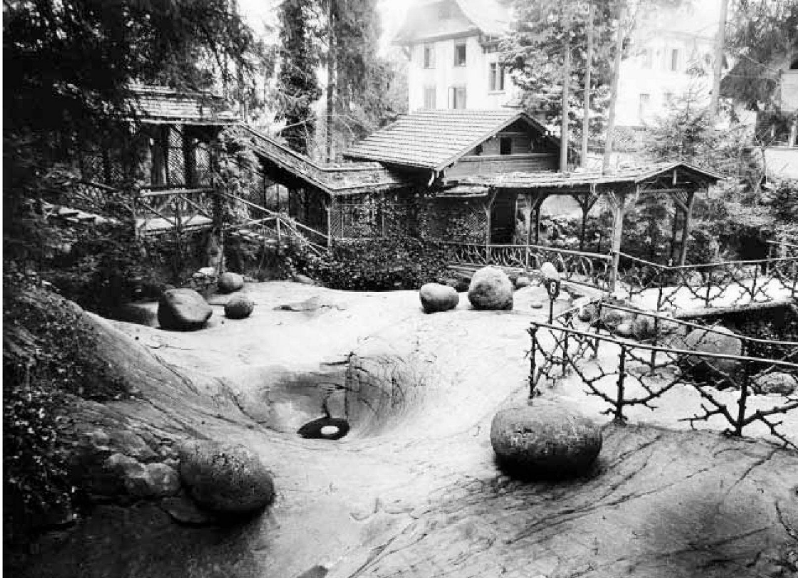
Kleinere Gletschertöpfe, im Vordergrund Gletscherschliff mit geschrammter Oberfläche, nach 1890 (Photoglob alt No. B. 271)