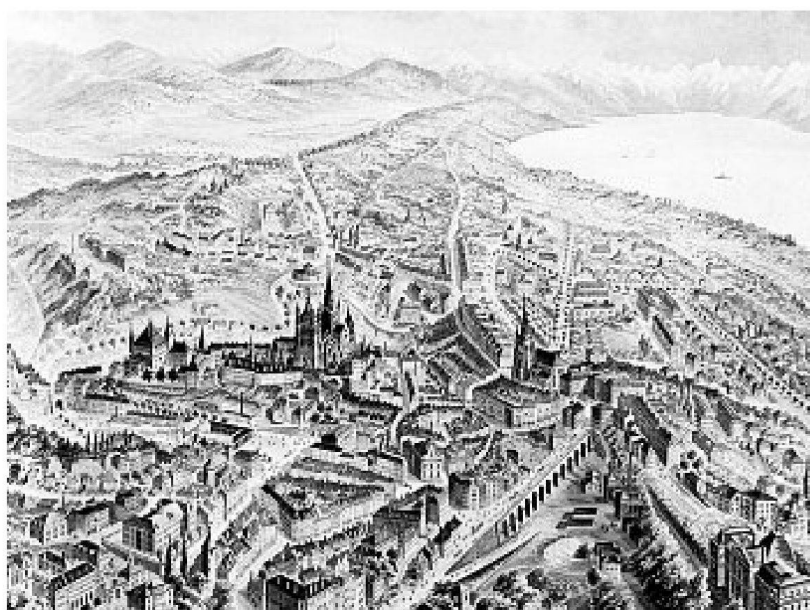
Etablierung einer ringförmigen Verkehrsverbindung Laussanes durch den Bau der Grand-Pont und des Tunnel de Barre.