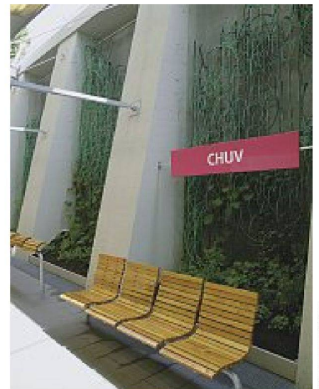
Bilder: Francesco della Casa