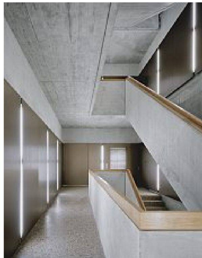
Treppenanlage im Wohnhaus