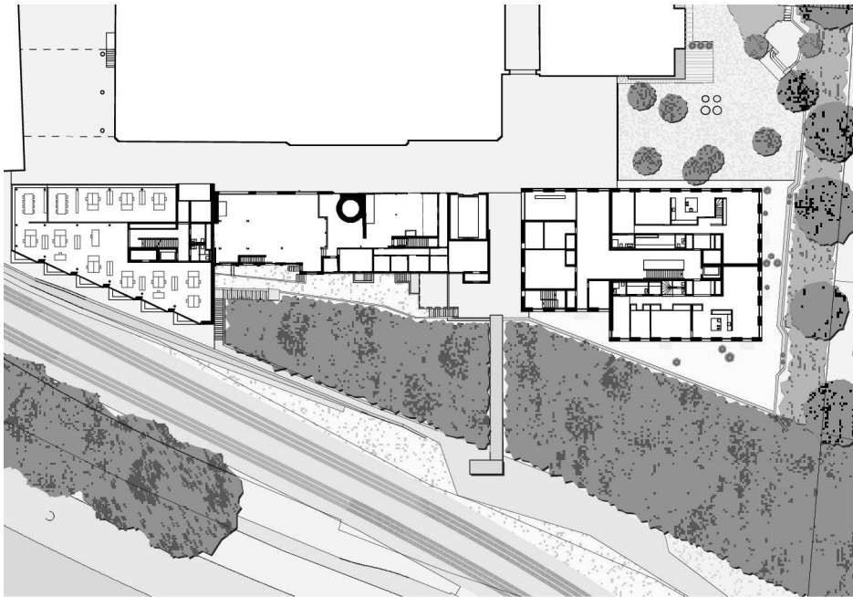
Erdgeschoss Berganlage: links Bürogebäude, rechts Wohngebäude Malzturm

Stockwerk einzigartige Ausblicke auf nahe- und fernliegende Gebiete der Stadt oder auch auf den Üetliberg. Zum Reichtum der Möglichkeiten tragen auch die Loggien in den beiden Längsfassaden bei, die sich nach aussen diskret in die Struktur einfügen und doch auf die erwähnten Verhältnisse überzeugend einwirken. So wie sie die Fassadenstruktur intakt belassen, nach innen aber grossflächig verglast sind, erzeugen sie eine zwischen innen und aussen wirksame Porosität, die nicht auf Kosten der baukörperlichen Prägnanz geht.