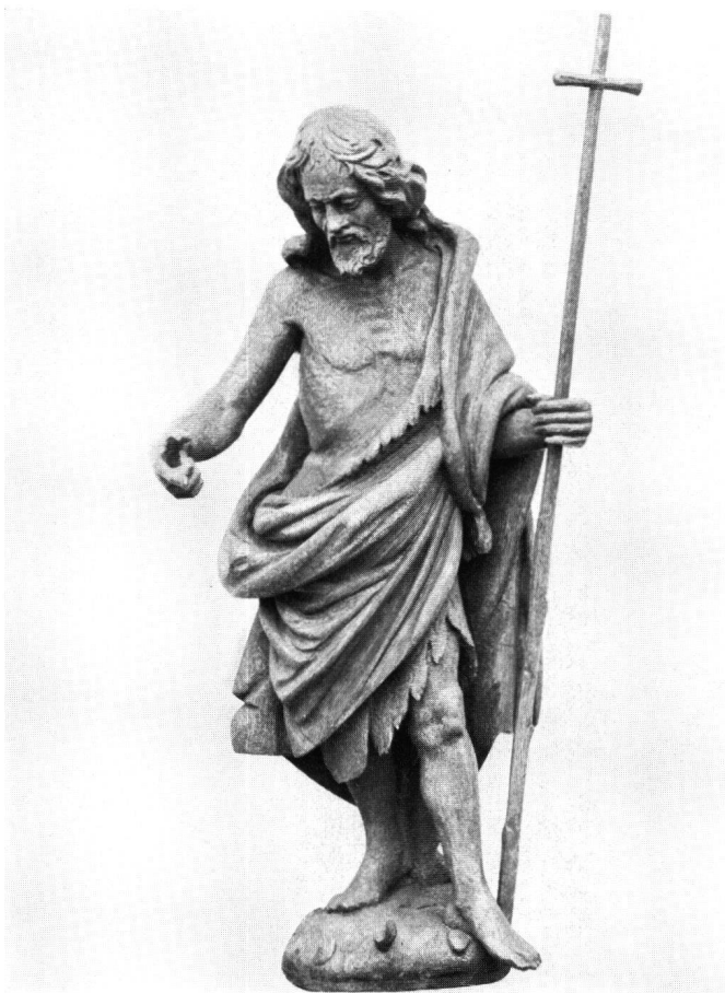
Abb. 6 J. F. Buol: Heiliger Johannes der Täufer. Von der ehemaligen Kirchengestaltung in Grieben. Um 1683. Privatbesitz