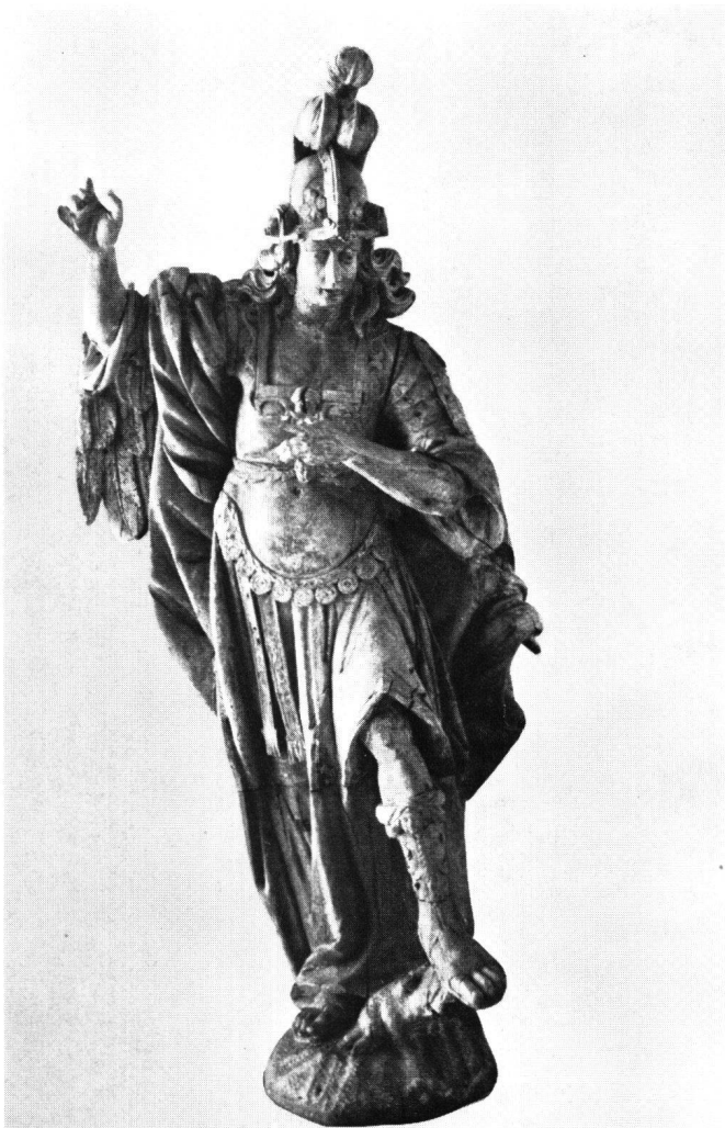
Abb. 3 J.F. Buol: Erzengel Michael vom Hochaltar in Grieben. Um 1683. Privatbesitz. Frontalansicht