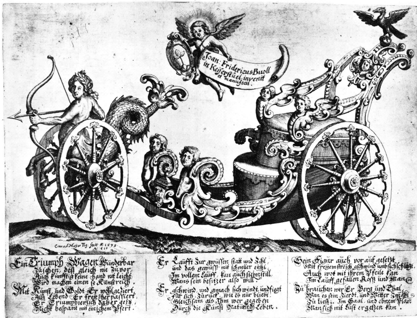
Abb. 14 J. F. Buol: Prunkwagen mit automatischem Antrieb, entworfen und ausgeführt von dem Kaiserstuhler Bildhauer. Gestochene Ansicht von Conrad Meyer in Zürich 1679.