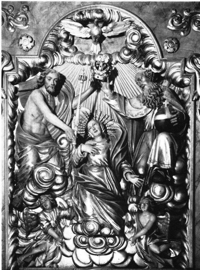
Abb. 1 J.F. Buol: Krönung Mariä aus dem Hochaltar von Grießen, jetzt im Hochaltar von Bühl. Um 1683

In einem knappen Aufsatz skizzierte ich vor einigen Jahren einen Überblick der Hauptmeister und Strömungen barocker Plastik des 17. Jahrhunderts im Gebiet der Zentral- und Nordschweiz. Es zeigte sich bei dieser Zusammenstellung, daß gleichzeitig eine ganze Generation von profilierten Altersgenossen in diesen Gebieten tätig war: in Luzern Michael Hartmann (geb. 1640, gest. um 1695/1699), in Sursee Hans Wilhelm Tüfel (geb. 1631, gest. 1695), in Zug Johann Baptist Wikart (geb. 1635, gest. 1705), in Kaiserstuhl am Rhein, heute Kanton Aargau, Johann Friedrich Buol (geb. 1636, gest. 1700). Neben sie ist als Zeit- und Artgenosse der Konstanzer Christoph Daniel Schenk (geb. 1633, gest. 1691) zu stellen, dessen Tätigkeit bis Einsiedeln reichte.