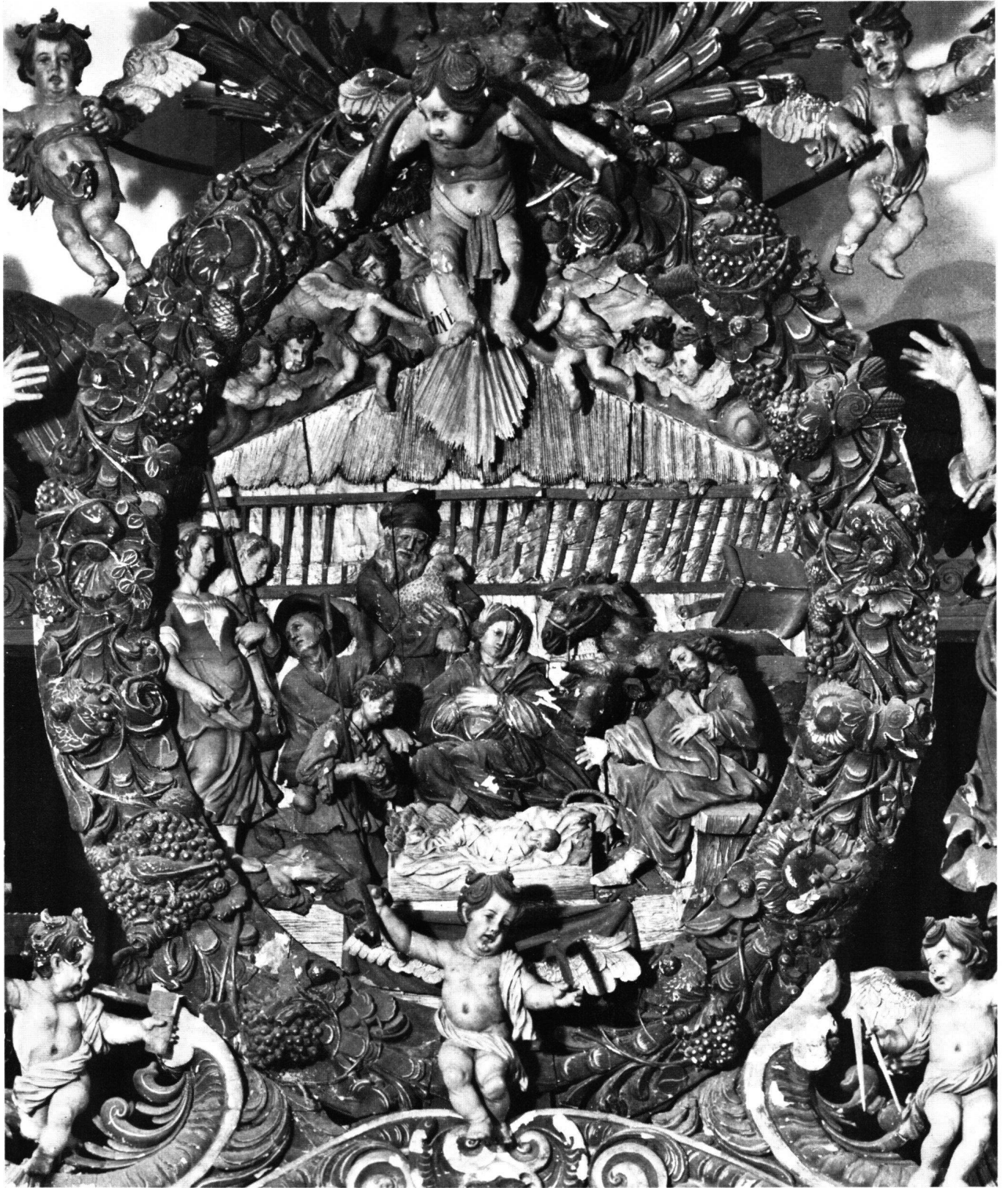
Abb. 10 J.F. Buol: Altar des heiligen Josef aus dem Kloster Mariastein. Von 1690. Hauptrelief mit Anbetung der Hirten