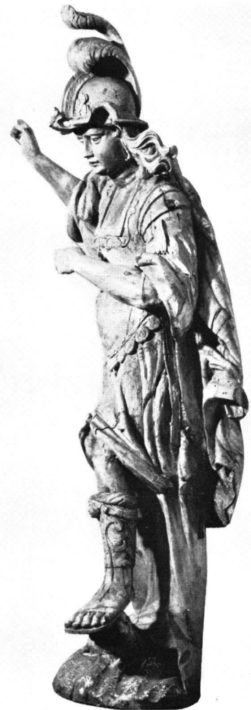
Abb. 4 J.F. Buol: Erzengel Michael vom Hochaltar in Grieben. Um 1683. Privatbesitz. Ansicht der linken Seite