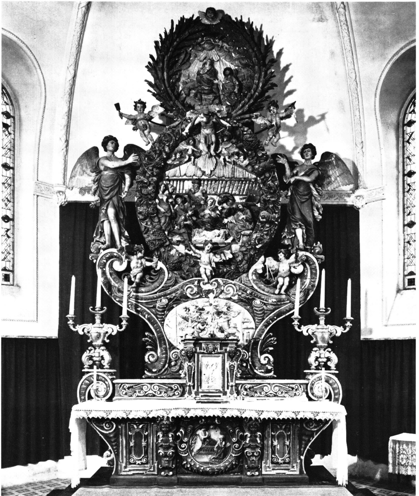
Abb. 9 J.F. Buol: Altar des heiligen Josef aus dem Kloster Mariastein, Kanton Solothurn, jetzt in der Pfarrkirche Buschwiller im Elsaß. Von 1690 (mit neubarocken Zutaten, wie Tabernakel und Leuchterbank, von 1886). Die damalige, hier sichtbare Neufassung ist seither durch eine das Werk noch viel mehr beeinträchtigende Versilberung und Vergoldung ersetzt worden