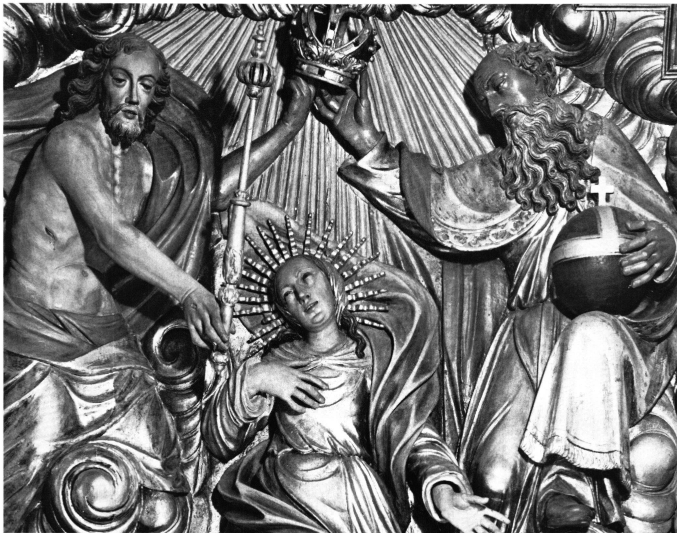
Abb. 2 J.F. Buol: Krönung Mariä aus dem Hochaltar von Grieben, jetzt im Hochaltar von Bühl. Um 1683. Detail

zu mahlen, die Mäntel daran innerhalb zu lassiren und ausserhalb zu vergulden: das um dise heyl. (Dreifaltigkeit) befindliche Gewülk hell schimmernt zu versilbern, und mit blauer Lasur aus zu schatiren. Den heyl. Petrum et Paulum so seitwerths stehen auf Allenpaster Arth an dem Leib: die Gewänder aber an dem End mit Gold zu garniren, auch die oberhalb stehende zwey grosse Engel auf eben dise Arth und Weis zu verfertigen, und den Tabernakel samt darneben stehenden Reliquien Bekleidung auch Antepindium an glater Arbeith wie den Altar zu marmoriren und das Laubwerk bestens zu vergulden.»