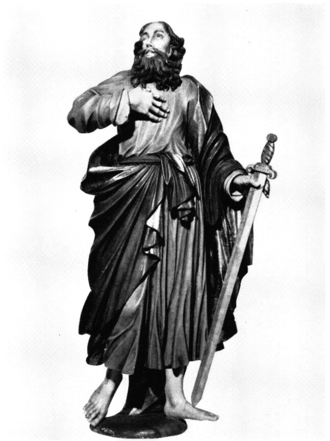
Abb. 7 J. F. Buol: Heiliger Paulus vom Hochaltar in Grieben. Pfarrkirche Grieben. Um 1683

Buols eigenhändigen Arbeiten. Sie wären in diesem Fall einem Gesellen zuzuweisen.