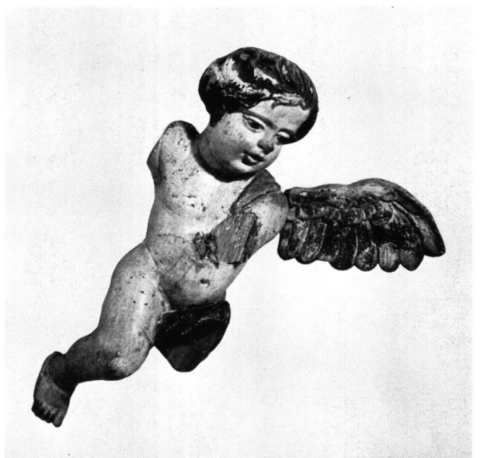
Abb. 8 J. F. Buol: Putto von der Kirchengestaltung in Grieben. Um 1683. Privatbesitz