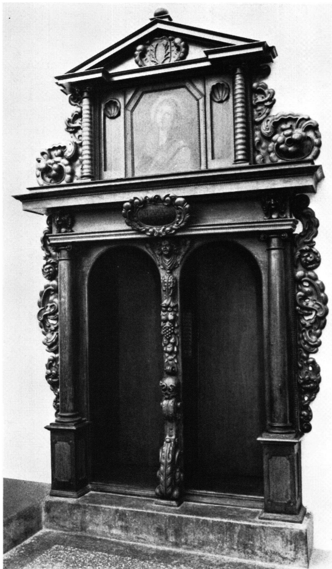
Abb. 12 J.F. Buol zugeschrieben: Beichtstuhl im Chor des Münsters zu Säckingen. Um 1679

tuschen und Früchtegehänge bilden den Dekor. Denselben Ornamentschatz, jedoch prägnanter und spannungsvoller, finden wir an den Beichtstühlen. Sie sind portalähnlich als zweigeschossige Ädikulen aufgebaut. Die Wangen bilden dynamische Knorpelkompositionen. Den Mittelpfosten zieren Fratze, Totenkopf, Fruchtgehänge und schreiender Engelskopf. Dieser ganze Dekor ist aufs engste mit dem Prunkfahrzeug Buols von 1679 verwandt, also wohl sogar gleichzeitig.