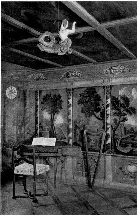
Zimmer aus dem «Löwen» in Dießenhofen 1755