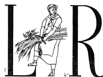
Eine «mamma rumantscha» mit Distel (in: Caricaturas 1981:24).