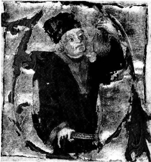
Abb. 2: Seit dem Mittelalter gab es die Trennung zwischen den zwei Berufsgattungen Arzt und Apotheker. Die Diagnose von Krankheiten wurde oft mittels Beschauen, Beschnüffeln und Schmecken des Urins vorgenommen. Das Thema Arztbesuch wurde mit Vorliebe auf komödiantische Weise in Fastnachtspielen abgehandelt - wie im Luzerner Wunderdoktor.