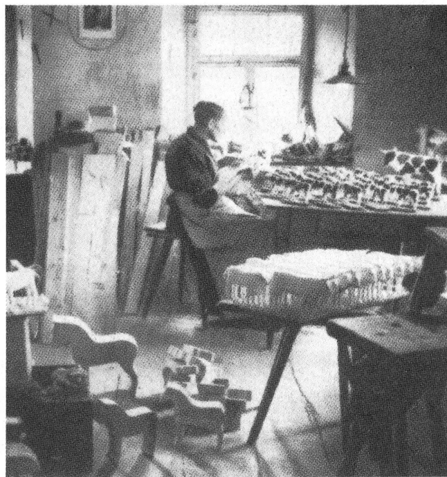
Heimarbeit um 1910

Es entstand ein Bildungsprogramm, das an dieser Leitvorstellung orientiert war. Private Initiativen machten den Anfang, proletarische Mädchen in den weiblichen Tugenden zu unterrichten. Sie bewirkten eine Wende in der Volksschulbildung, wo seit 1897 die hauswirtschaftliche Unterweisung in den Stundenplan der Mädchen aufgenommen wurde. Bis zu diesem Zeitpunkt war die öffentliche Bildung für Mädchen wie Jungen auf die Erwerbstätigkeit gerichtet gewesen. Die neuen Erziehungsziele für Mädchen zentrierten sich um die beson-