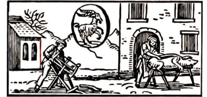
Bauernregeln im Christmonat

Fangen die Nachtigallen in den Stuben bald nach Weihnachten zu schlagen an, so wird der Frühling warm und früh; wenn sie spät anfangen, spät und kalt. Kalter Christmonat mit viel Schnee verheisst ein fruchtbares Jahr.