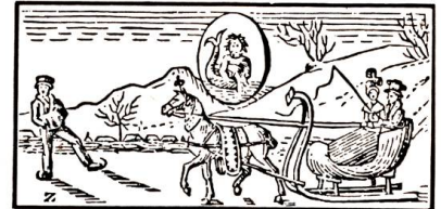
Bauernregeln im Jänner

Im Jänner kann man sehen, was für Witterung in jedem Monat des Jahres kommen wird; ist der Anfang, das Mittel und das Ende gut, so gibt es ein gedeihliches Jahr. Donner bedeutet grosse Kälte.