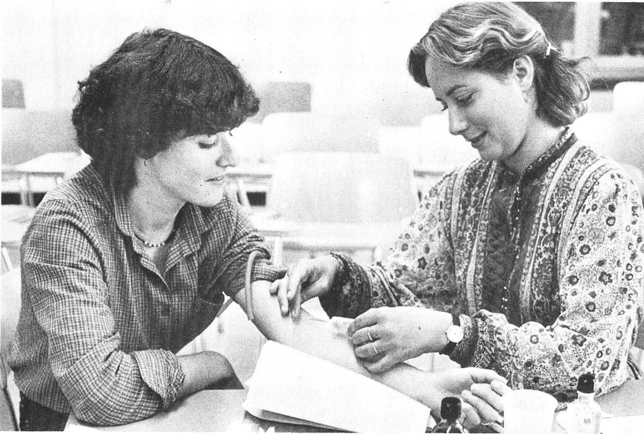
Les jeunes «recrues» se font mutuellement une prise de sang