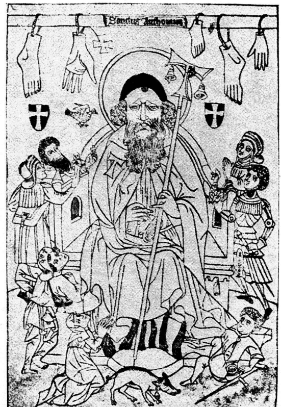
Saint Antoine, bois du XV e siècle. Le saint est entouré d'ex-votos rappelant la gangrène des membres dont étaient atteints les malades sollicitant sa protection. Cabinet des estampes de Munich, reproduit par le Dr Henry Chaumartin dans son ouvrage «Le mal des ardents et le feu Saint-Antoine», Vienne-la-Romaine, 1946. Dépôt pour la Suisse, Librairie centrale et universitaire, Lausanne.

Curiosité du monde biologique, poison violent responsable autrefois et plus rarement de nos jours de véritables vagues de terreur, remède quasi indispensable à la médecine moderne, tel est l'ergot de seigle qui a défrayé la chronique ces derniers temps.