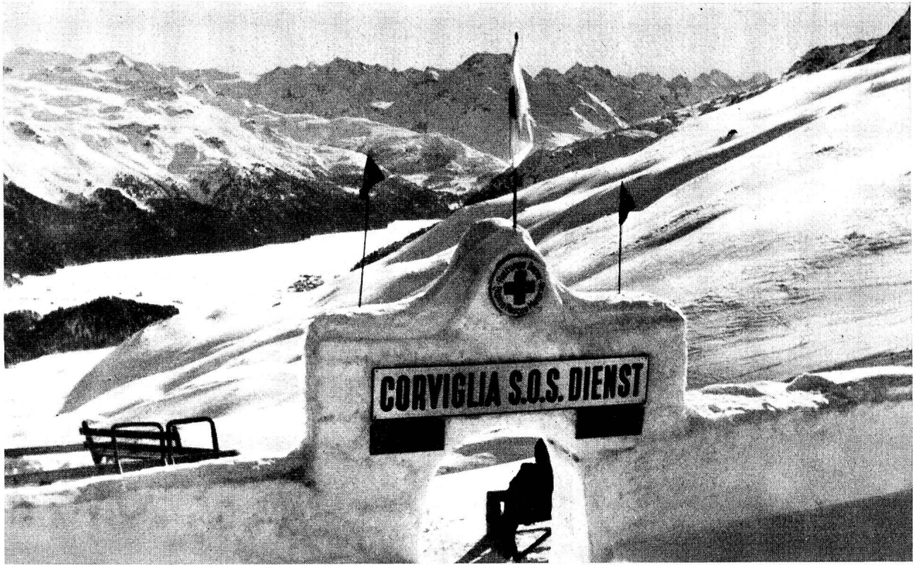
Poste de secours au terminus d'un ski-lift.

Suisse une littérature abondante et instructive. L'agenda 1949 de l'Alliance suisse des samaritains, par exemple, contient plusieurs photographies et clichés Röntgen pris par notre service sanitaire qui a fonctionné durant les Jeux Olympiques d'hiver de 1948. Nous y constatons qu'à l'exception d'un coup de pistolet tiré par un Suédois dans la jambe d'un gendarme grison, pendant le pentathlon militaire, les quelques accidents graves dont il est fait mention se sont produits au cours de compétitions de ski.