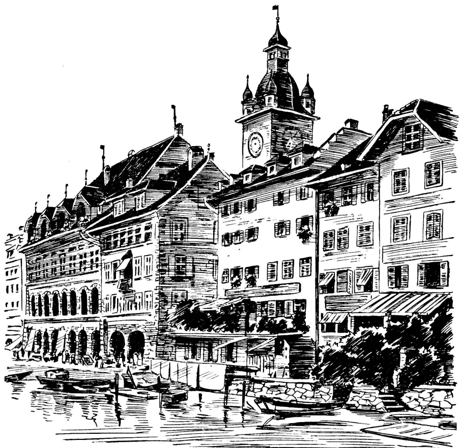
Alt-Luzern: Das Rathausquai um 1830.

Neben der von allen Besuchern Luzerns bewunderten Kapellbrücke führt die weiter reussabwärts, unterhalb der Reussbrücke gelegene Spreuerbrücke ein trotz bedeutenderen künstlerischen Wertes weniger beachtetes Dasein. Von drei Pfeilern getragen, verbindet sie, wie die Kapellbrücke, in gebro-