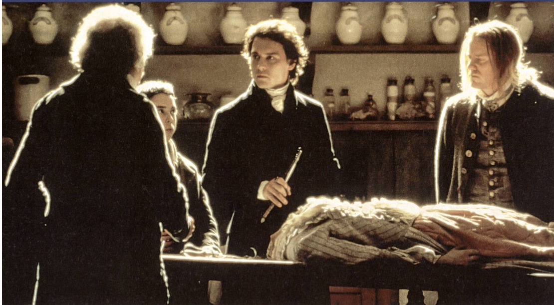
Ichabod Crane, un rationaliste confronté à des crimes surnaturels (Johnny Depp)

de son œuvre. Normal dès lors qu'il lorgne également du côté de Francis Ford Coppola (ici son producteur exécutif), et plus particulièrement de la relecture par celui-ci d'un autre classique du fantastique, le Dracula de Bram Stoker.