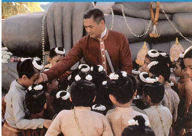
Mongkut, figure romancée d'un vrai monarque (Chow Yun Fat)