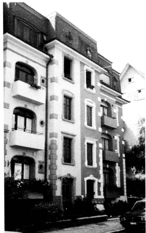
Im heute vollständig renovierten Wohnhaus an der Cäcilienstrasse Nummer 20 logierte Mussolini während seines Berner Aufenthaltes im Jahre 1903.