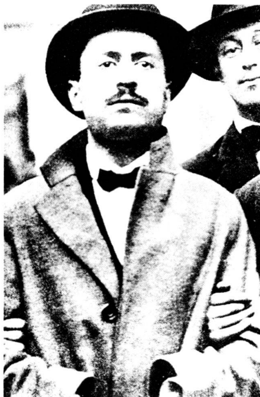
Mussolini, der junge Revolutionär: Sein Aufenthalt in der Schweiz beeinflusste entscheidend seine späteren politischen Vorstellungen und Ziele.