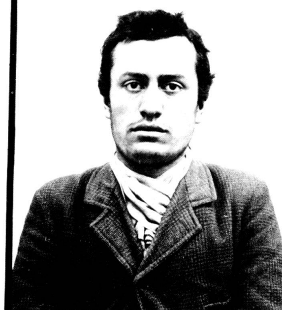
Polizeifoto Mussolinis, aufgenommen am 19. Juni 1903 während seiner Haft im Berner Untersuchungsgefängnis.