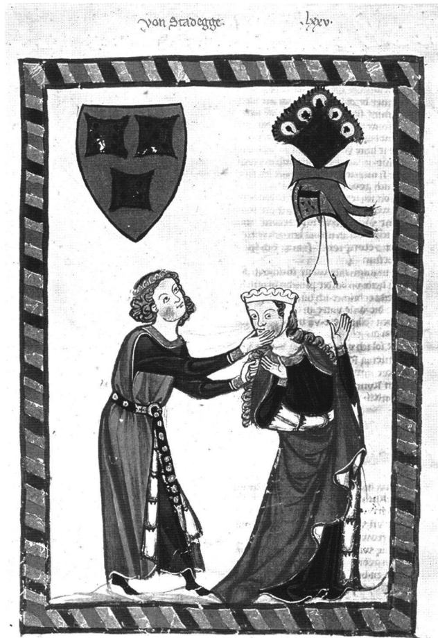
Abb. 2 Der von Stagede. Codex Manesse, fol. 257v, um 1300. Heidelberg, Universitätsbibliothek.

Selbstredend, dass auch die Gattenwahl für die zu verheiratenden Mädchen sorgfältig geprüft wurde. Alles in allem bedeutete diese Entwicklung hin zum Patrimonium für die Frauen einen Verlust an Selbständigkeit. So verloren die Frauen in Norditalien in der Mitte des 12. Jahrhunderts das alte Recht, einen Drittel des Männerguts ( tercia ) zu erben. 9