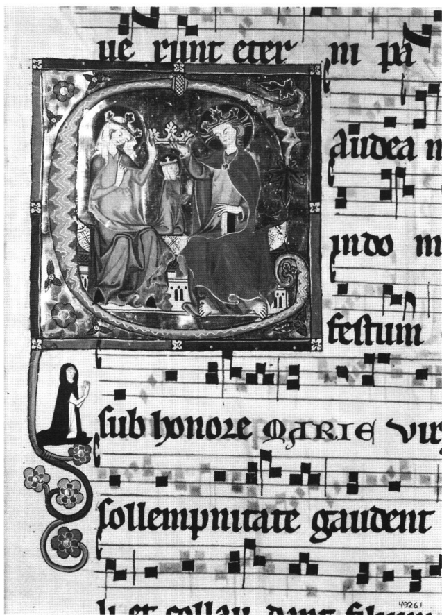
Abb. 6 Initiale G. Christus und Maria setzen einer kleinen Frauengestalt (Seele Mariens) die Krone auf. Graduale von Sankt Katharinenthal, fol. 188r, dat. 1312. Zürich, Schweizerisches Landesmuseum.