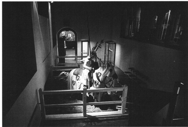
Abb. 1 Das Turnier. Besiegte und Sieger. Inszenierung in der Ausstellung zur Manessischen Liederhandschrift, Schweizerisches Landesmuseum 1991.

Ritterrüstung, aber Bedeutung erhielten nicht die Ruhmes-taten sondern in der Beschreibung des höfischen Alltags im Mittelalter auch der kulturelle und produktive Beitrag der Frauen ...». 3