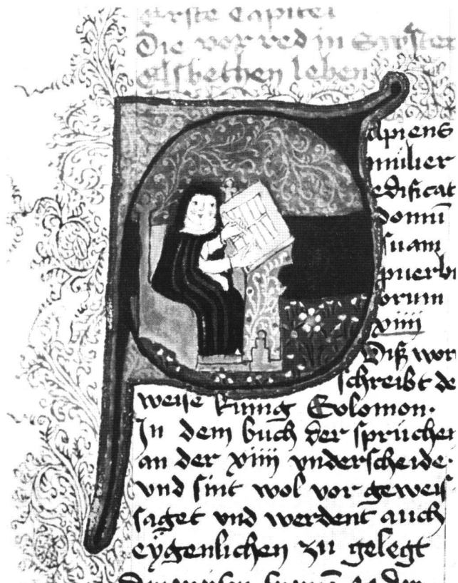
Abb. 7 Elisabeth Stagel. Tösser Schwesternbuch, fol. 3r, um 1450. Nürnberg, Stadtbibliothek.