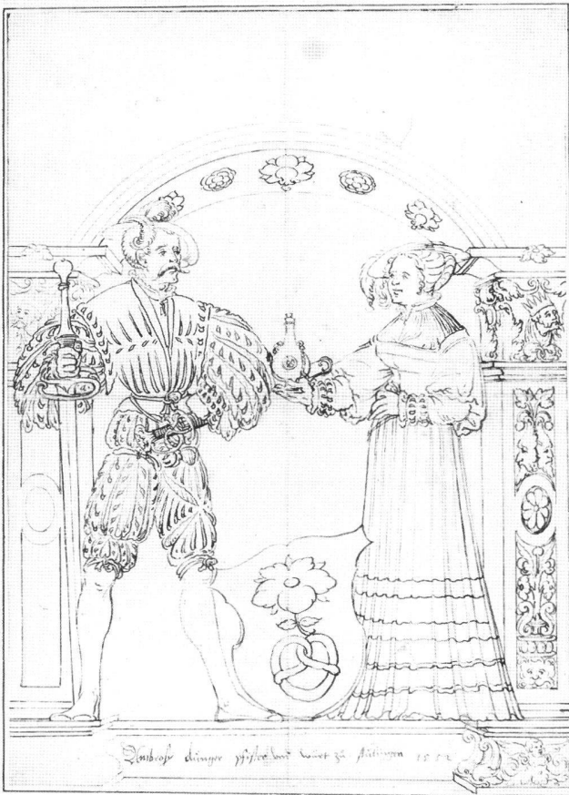
Abb. 3 Scheibenriss zu einer Stifterscheibe des Ambrosius Dunger, von Hieronymus Caspar Lang d.Ä., datiert 1552. Wien, Porträtsammlung der Österreichischen Nationalbibliothek, LAV VIII/65/2270.

Der graphische Duktus wirkt in den beginnenden 1550er Jahren sicherer. Auch beginnt Hieronymus Lang d.Ä. seine Risse symmetrischer zu gestalten: An der Kreuzstelle der Längs- und Querfalte platziert er den Mittelpunkt der Komposition, die Hand der Frau.