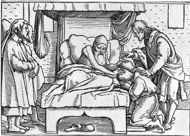
Abb. 11a Segnung von Efraim und Manasse durch Jakob, von Hans Holbein d.J., um 1526. Holzschnitt. Basel, Kupferstichkabinett der öffentlichen Kunstsammlung, Inv. Nr. X.2189.9.