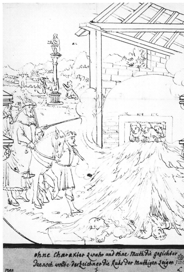
Abb. 16 Scheibenriss-Fragment zu einem Mittelbild mit den drei Jünglingen im Feuerofen, von Hieronymus Caspar Lang d.Ä., zwischen 1550 und 1580. Wien, Porträtsammlung der Österreichischen Nationalbibliothek, LAV XXIII/414/11031.

Nr. 16 (Abb. 16): Die Datierung des Scheibenriss-Fragments zu einem Mittelbild mit den drei Jünglingen im Feuerofen (Dan 3,21–27) ist äusserst schwierig.