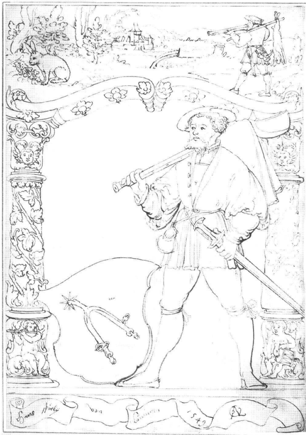
Abb. 2 Scheibenriss zu einer Stifterscheibe des Hans Spörli, von Hieronymus Caspar Lang d.Ä., monogrammiert und datiert 1549. Wien, Porträtsammlung der Österreichischen Nationalbibliothek, LAV VIII/65/2284.

Auf einem mit Schriftrollen belegten unteren Abschnitt steht der mit Büchse und Schweizerschwert bewaffnete Stifter mit Barett und Geldbeutel. Zu seiner Rechten das