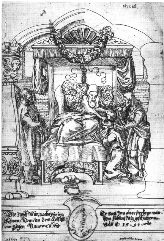
Abb. 11b Segnung von Efraim und Manasse durch Jakob, von Bartli Müller, datiert 1594. Scheibenriss. Zürich, Schweizerisches Landesmuseum, AG 11970.

lage gedient habe. 61 Den Lang-Riss hat Wyß niemals gesehen, wohl aber das Photo in Thönes wissenschaftlichem Nachlass im Schweizerischen Landesmuseum in Zürich. Auch übersah er für den Zuger Riss die Holbeinsche Druckvorlage.