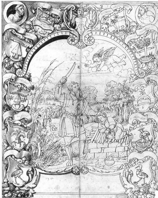
Abb. 5a Abrahams Opfer, unbekannter Berner Meister, um 1541–1552. Scheibenriss. Bern, Bernisches Historisches Museum, Inv. Nr. 20036.83.

Stilistisch ist das Blatt in die letzten 1550er Jahre einzuordnen. Obwohl der Glasmaler bei seinen Bildscheibenrissen detaillierter und genauer arbeitete, ist das Formen-