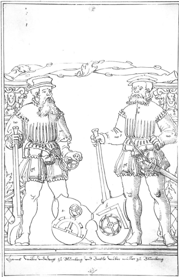
Abb. 6 Scheibenriss zu einer Familienscheibe der Gebrüder Weber, von Hieronymus Caspar Lang d.Ä., zwischen 1555 und 1560. Wien, Porträtsammlung der Österreichischen Nationalbibliothek, LAV VIII/65/2256.

von der immer sicherer geführten Linie angedeutet. In diesem Riss benutzt Hieronymus Lang d.Ä. die flächige Parallelschraffur.