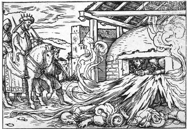
Abb. 16a Die drei Jünglinge im Feuerofen, von Hans Holbein d.J., um 1526. Holzschnitt. Basel, Kupferstichkabinett der öffentlichen Kunstsammlung, Inv. Nr. X.2189.79.

Man begegnet hier wiederum der Kopie nach einem Holzschnitt aus der Serie der Holbeinschen Icones von 1526 (vgl. oben S. 62, Nr. 5) (Abb. 16a), 1538 in Lyon gedruckt. 74 Komposition und Bildaufbau von Holzschnitt