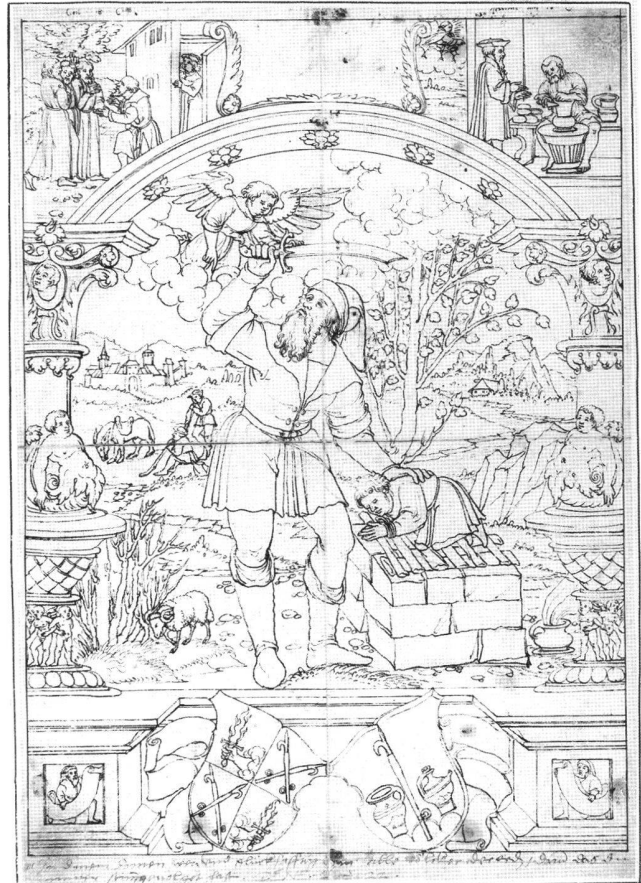
Abb. 5 Scheibenriss zu einer Bildscheibe mit Abrahams Opfer, von Hieronymus Caspar Lang d.Ä., zwischen 1550 und 1560. Wien, Porträtsammlung der Österreichischen Nationalbibliothek, LAV VIII/65/2245.

LAV VIII/65/2245. Blattmasse: 310×214 mm (Kaschierung: 461×314 mm). Feder in Schwarz; kaschiert; an der rechten unteren und an der linken oberen Ecke stark fleckig; z.T. fleckig; vereinzelte Risse, rückseitig verklebt; vereinzelte kleine Ausbrüche; Randlinien; Horizontal- und Vertikalknick. Beschriftet vom Künstler oben: Gen 18 G (links); Jeremia (...) (rechts); Tinkturangaben: br rot (= braun-rot); \text{☘} (Blättchensymbol = grün).