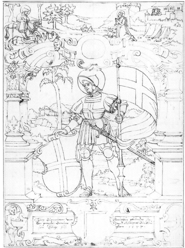
Abb. 13 Scheibenriss zu einer Bildscheibe des Jörg Bernauer, von Hieronymus Caspar Lang d.Ä., 1577 datiert. Wien, Porträtsammlung der Österreichischen Nationalbibliothek, LAV VIII/65/2241.

Auf einem mit Putten, Schriftkartuschen und dem Stifterwappen besetzten Podest steht ein geharnischter Ritterheiliger vor einer reichen Landschaft. In seiner Linken trägt er ein Kreuzbanner, mit der rechten Hand stützt er den Wappenschild. Alles ist umrahmt von antikisierenden Architekturelementen, die nur in der linken Hälfte im Detail ausgeführt sind. Im Oberlicht: der den Drachen tötende heilige Georg links, die betende Prinzessin mit dem Lamm und ihre Eltern als Zuschauer in der Burg rechts.