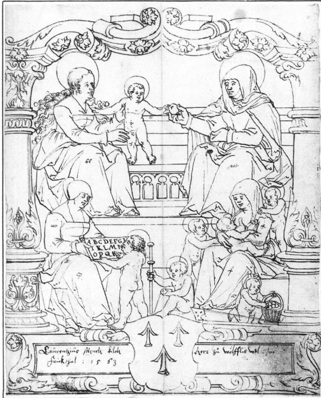
Abb. 7 Scheibenriss zu einer Bildschiebe des Laurentius Storch, von Hieronymus Caspar Lang d.Ä., datiert 1563. Wien, Porträt-sammlung der Österreichischen Nationalbibliothek, LAV VIII/65/2244.

Der mehrschichtige Aufbau der Komposition verrät die Intention einer Tiefenwirkung (Nischenarchitektur?), ohne dass aber die natürliche Perspektive streng befolgt würde, sind doch die entfernter, hinten oben sitzenden Frauenfiguren grösser dargestellt als jene im Vordergrund, da es sich offenbar um die ikonographisch wichtigeren handelt. Ihr Sitzen wirkt labil, das Kind zwischen ihnen scheint eher zu schweben als zu stehen.