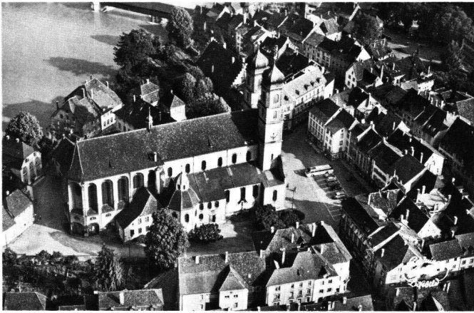
Abb. 2 Der Stiftsbezirk von Säckingen, Flugaufnahme, um 1960.

gende Gruppe «Adel» bestand wohl aus Gästen und Verwandten der Stiftsmitglieder und Vornehmen der Region.