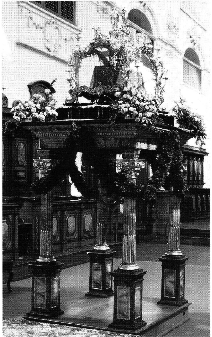
Abb. 4 Die Aufstellung des Fridolinschreines auf dem Gerüst von 1782 am Fest des Patrons.

Ein Blick auf die Träger der Fridolinsrolle bietet einen Querschnitt durch die Stände der Säckinger Bevölkerung. Wenn 1732 und 1733 je dreimal Freiherren von Schönau vor-