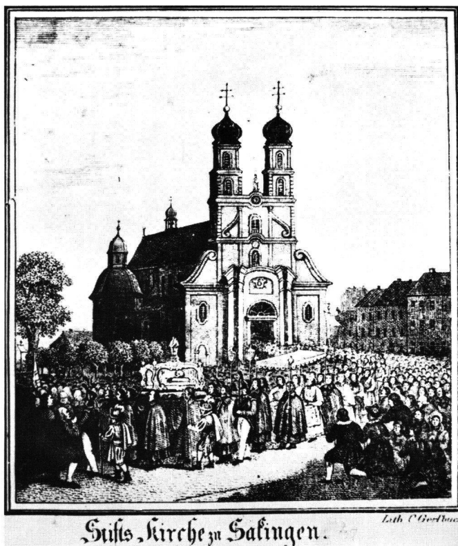
Abb.3 Stifts-Kirche zu Säckingen, von C. Gersbach, um 1840. Lithographie. Älteste Darstellung der Fridolinsprozession. Säckingen, Stadtarchiv.

Das Programm von 1759 mit der Präsentation vom Sterben und Grab St. Fridolins zeigt die ersten drei Bilder «in einem Zimmer» beziehungsweise «halb offenen Zimmer». In Nr. 4 ruht der Heilige auf einem Paradebett,