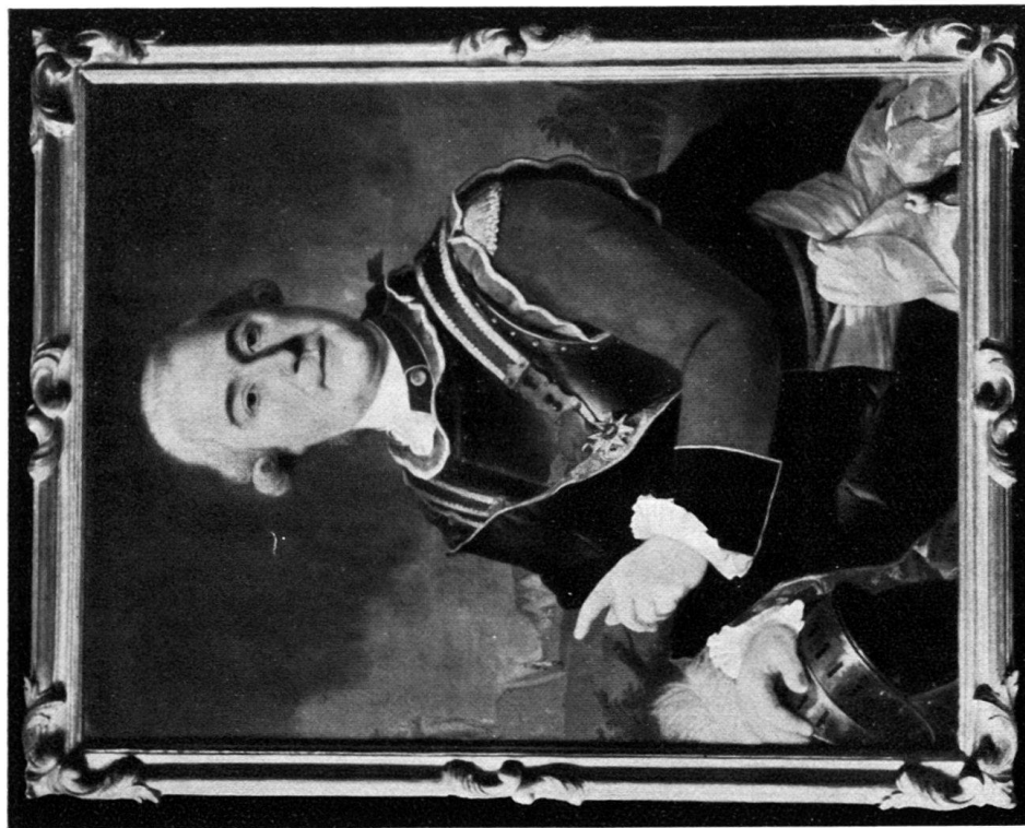
Le Capitaine Macognin de la Pierre 1768.