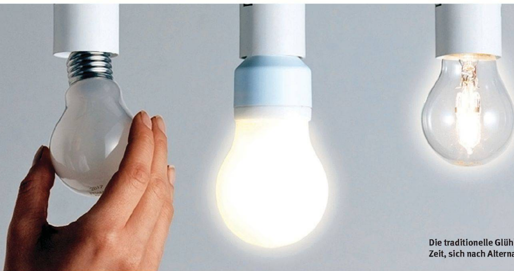
Die traditionelle Glühlampe hat bald ausgedient. Zeit, sich nach Alternativen umzusehen.

Stromsparlampen, Eco-Halogenlampen und LED-Leuchten bieten sich als ökologischere Alternativen an und ermöglichen ganz neue Lichteffekte. Was es dabei zu beachten gilt.