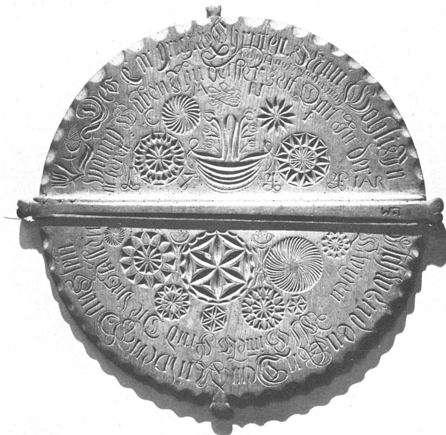
Abb. 7 Käsedeckel mit Kerbschnitzerei Diemtigtal 1744

Daß der Volkskunst ein Anrecht auf autonome wissenschaftliche Behandlung zukommt, dürfte nach den Untersuchungen Freyers nicht mehr bestritten werden können. Der Vorwurf einer «ästhetisierenden, modisch gefärbten Betrachtung», den Dr. Fritz Gysin im letzten Jahresbericht des schweizerischen Landesmuseums erhebt, ist nicht gerechtfertigt und verkennt die Tatsachen. Die schweizerische Volkskunst ist nicht eine Manifestation nur «untergeschichtlicher» Lebensformen und als solche der individuellen und bewußten Formung in schroffem Gegensatz gegenübergestellt. Gerade ihre eigenartige Zwischenlage, ihr Transzendieren in andere Bereiche macht sie für die Forschung so reizvoll und interessant.