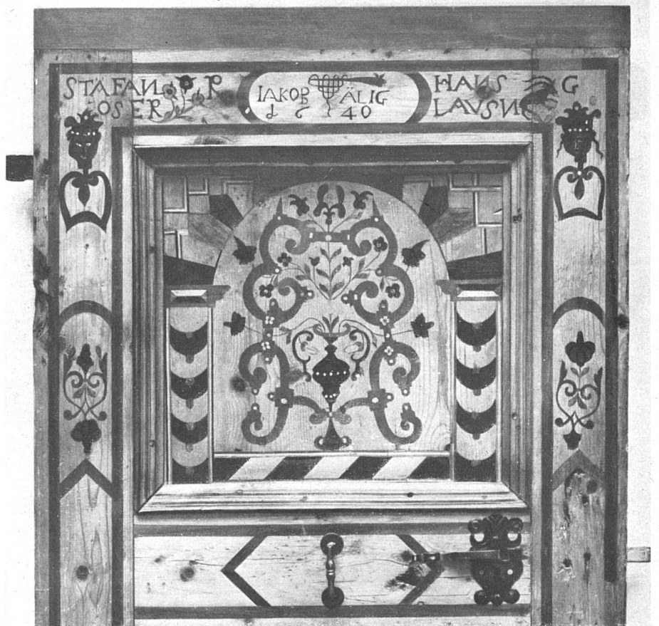
Abb. 3 Eingelegte Türfüllung Kandersteg 1610 Historisches Museum Bern

Was unter Vergröberung und Erstarrung verstanden wird, ist klar. Mit der Verlangsamung meint Freyer das Nachlassen einer formalen Spannung, das Zäherwerden einer flüssigen ornamentalen Bewegung, beispielsweise einer Wellenranke. Die künstlerische Energie des Maureskenornaments auf der Neuenstädter Truhe (Abb. 2) geht bei einer ähnlichen Darstellung auf der Türfüllung von Kandersteg (Abb. 3) völlig verloren. Die Truhe aus Neuenstadt muß als ein typischer kleinstädtischer Grenzfall zwischen Volks- und Provinzialkunst angesehen werden. Das Füllungsornament dürfte auf ein gleiches Vorbild oder direkt auf einen Ornamentstich zurückgehen. Der Sockel zeigt die gedrückten Formen der westschweizerischen Gotik des frühen 16. Jahrhunderts. Das Dekor der Rahmenleisten spielt in seiner Spannungslosigkeit unmittelbar hinüber in die Volkskunst.