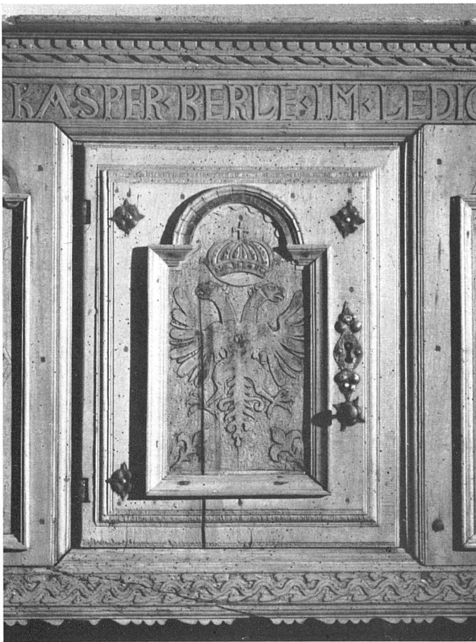
Abb. 4 Geschnitzte Schranktürfüllung 1755 Oberhasli Verkehrsverein Meiringen