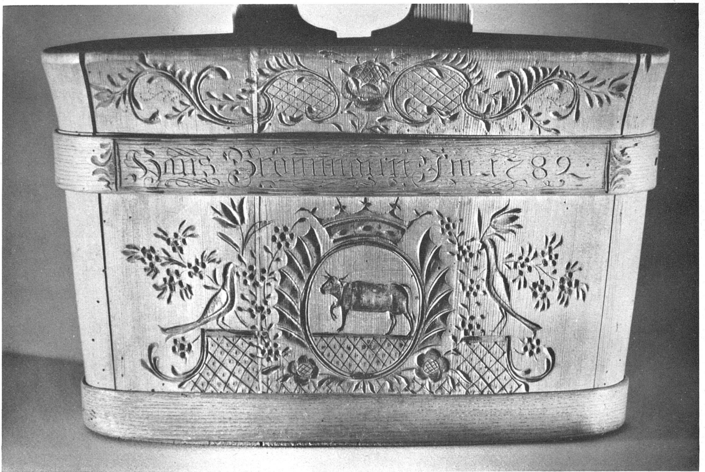
Abb. 6 Melchler mit Kerbschnitzerei Emmental 1782 Historisches Museum Bern

im Sinne der technologischen Erklärung gerade für dieses Gebiet nicht völlig ignorieren.