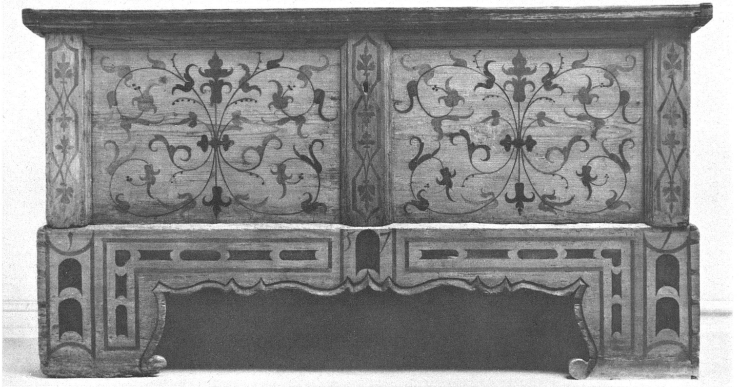
Abb. 2 Eingelegte Truhe Neuenstadt 1577 Historisches Museum Bern