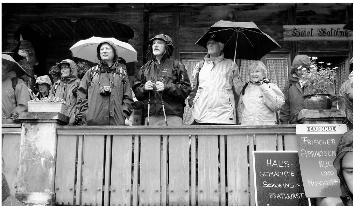
Fig. 4: Audience at the Waldhaus to Adrian Pfiffner's account of the disaster faced by the constructors of the first Lötschberg railway tunnel in 1908.

After about an hour's drive from Interlaken, along the Lake of Brienz, past the Aare Gorge and Meiringen, some 70 people gathered at Handeck, on the north flank of the Grimsel Pass. They were divided into four groups, one English-speaking, for the tour of the three Handeck power stations of KWO (Kraftwerke Oberhasli). The subsequent 1½ hours were spent underground, generally in tunnels and caverns with turbines and generators, often with considerable noise. Everything was clean, well organised, and