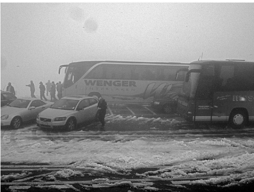
Fig. 7: Snow on the Grimsel Pass.