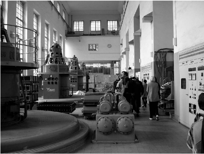
Fig. 6: Visitors at Powerstation Handeck 1: hall with turbines and generators.

past Handeck to a spot called Rotlauri, near Guttannen (Fig. 9). This is the site of a landslide that happened in 2005. It blocked the road and created a temporary lake. The landslide was probably induced by thawing of permafrost at an altitude of 3000 m a. s. l. combined with a period of abundant rain. It covered an area of 10 hectares with loose rock and debris up to 20 m thick and demonstrates the erosional force of such a landslide.