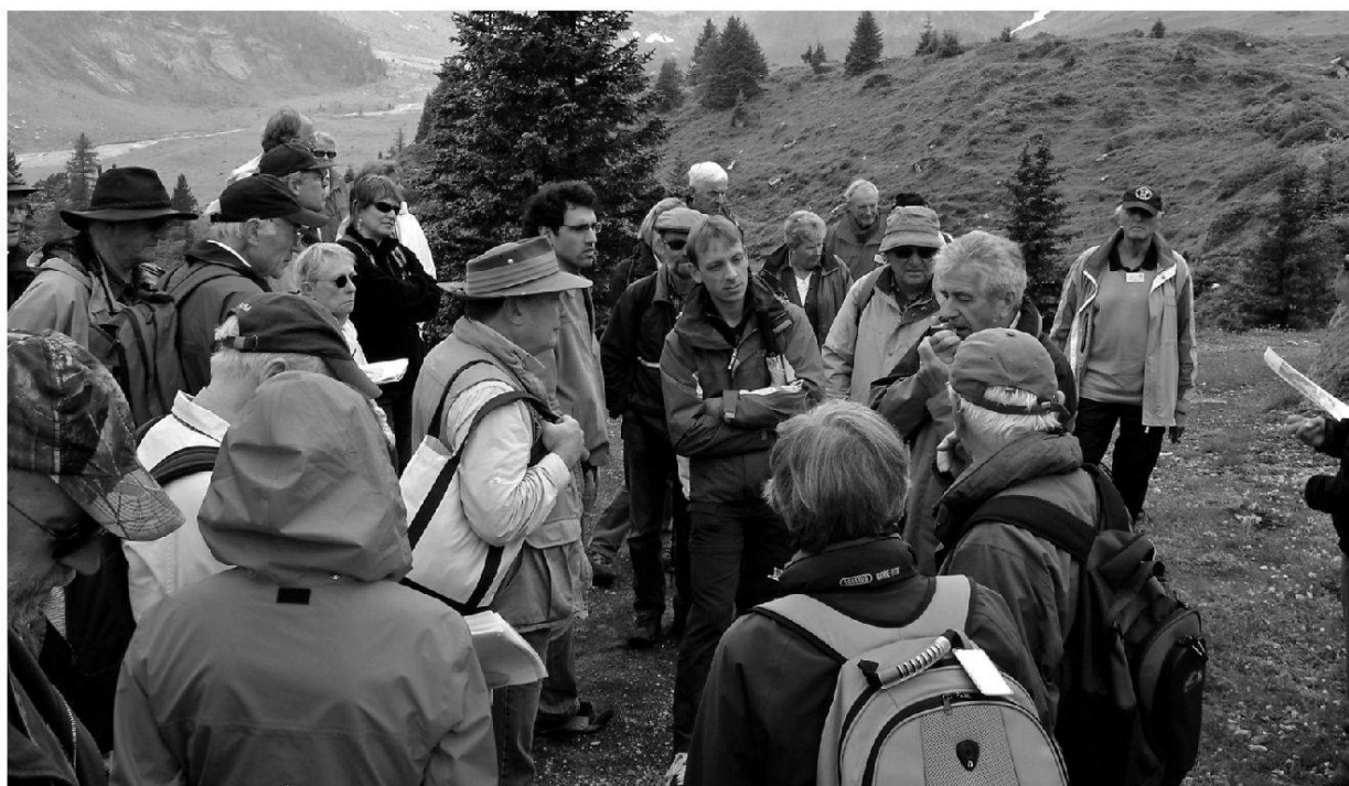
Fig. 5: Sunnbüel: Valley in background is the site of two big historic icefalls.

Then the ride went down the Grimsel road,