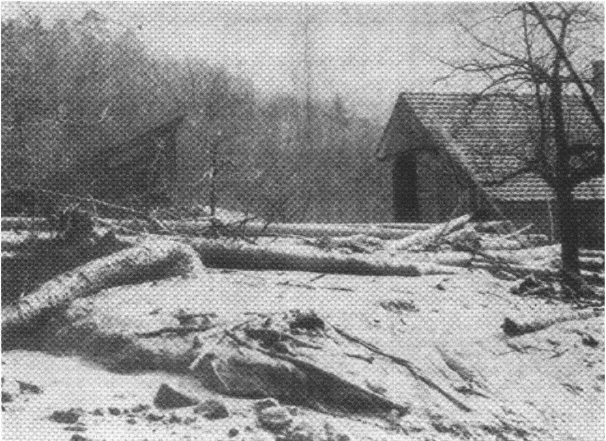
Fig. 1: Häuser von Chänelmoos nach dem Murgang.

Im Anschluss an den Murgang stellten sich verschiedene geologische Fragen: