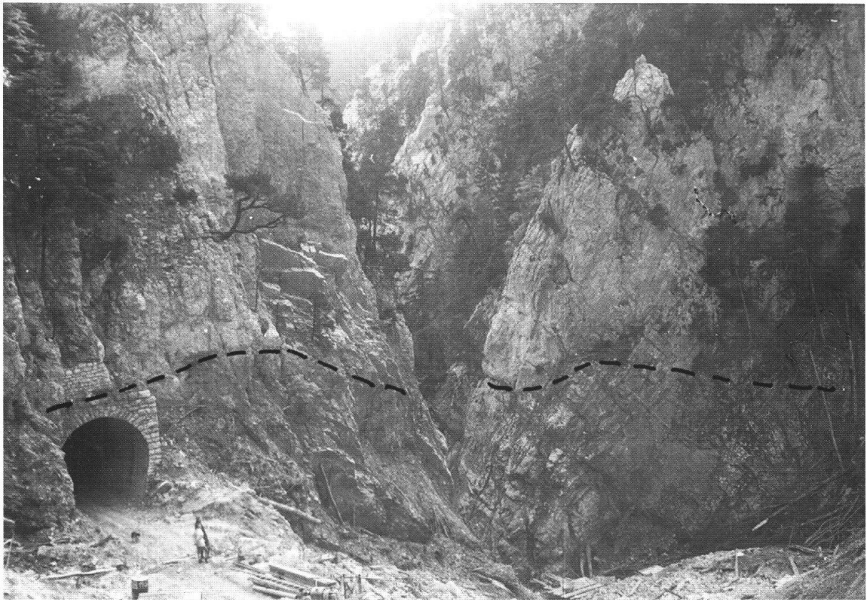
Fig. 3: Die Lochbachklamm und der Strassentunnel nach der Räumung, Sicht von Norden. Die gestrichelte Linie bezeichnet die Höhe der Ablagerungen vor dem Murgang (Foto H. Fröhlicher, 1. November 1970).

gebietes markiert. Die Störung trennt den normalliegenden Südschenkel der Weissenstein-Antiklinale im NE (Hasenmatt) vom zunehmend überkippten im SW (Bettlachstock).