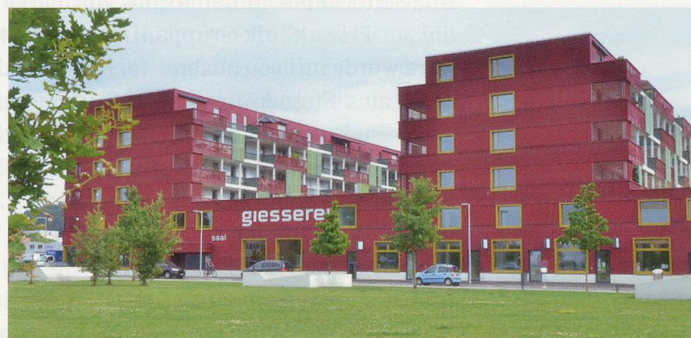
«Wohnform der Zukunft»: Mehrgenerationenhaus in Winterthur.