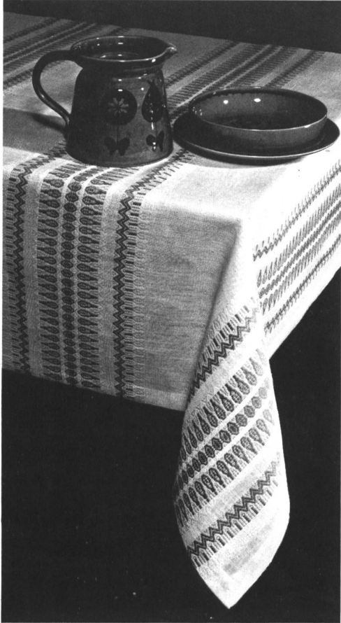
Reinleinen-Tischtücher in Handwebart, einmal echtroh, einmal meliert.

Tapis de table mi-fil, genre tissage main, l'un écri naturel, l'autre en couleurs mélangées.