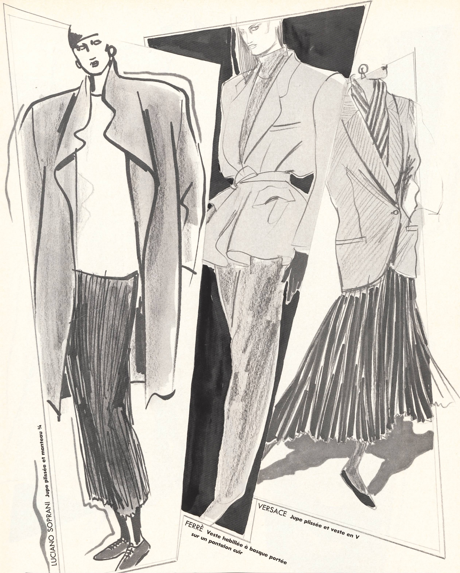
LUCIANO SOPRANI Jupe plissée et manteau 3/4