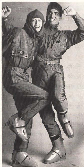
Modelle HCC SA

In einem breit gespannten Bogen und mit viel Engagement erläuterte die Viscosuisse ihr erfolgversprechendes Sport- und Freizeitprogramm, das in enger Partnerschaft mit Stoffherstellern