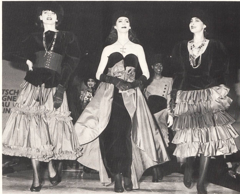
Kollektion Beatrice Hympehdahl

Der Klub der Modeavantgarde Berlin (KAB) schwelgte mit im Etagenlook sowie im Supermini à la 60er Jahre. Bei den Mänteln dominierten lässig weite, lange Herrentypen mit grossen aufge-