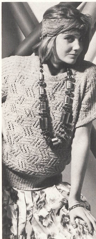
Modell Antigua. Diese Qualität aus reinen Naturfasern verfolgt den Trend der Matt/Glanz-Effektgarne mit Frisé-Optik und ist in 20 aktuellen Frühlingsfarben erhältlich.

Der farbliche Gesamteindruck signalisierte frische und heitere Töne. Die Einflüsse der Antike bescherten verschwommene Colorits, kombiniert mit frischen Blumenfarben, die damit ein zartes Farbenspiel ermöglichten. Die Dessins leben stark von graphischen Reliefmustern, Rippe in Quer und Längs, Web- und Flecht-Effekten. Interessant nach wie vor sind durchbrochene Muster.