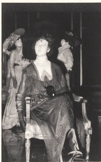
Musée des Arts de la Mode, Paris