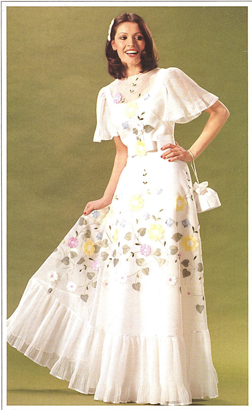
NELO J. G. NEF + CO. AG, HERISAU Multicoloured embroidery / Mehrfarbige Stickerei / Broderie multicolore.

légèrement structuré. La matière, soie, mélanges ou synthétiques, dépend de la classe de prix des modèles.