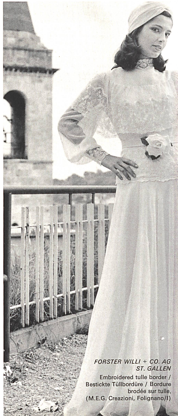
FORSTER WILLI + CO. AG ST. GALLEN

à la beauté du tissu et à la perfection de la façon. Broderie et dentelles sont toujours les éléments principaux dans la réalisation d'une romantique robe de noces. Les matières les plus utilisées sont la gracieuse guipure, la broderie artistement découpée, les bordures brodées avec incrustations de tulle et applications florales en blanc ou en coloris légers, les laizes brodées, souvent avec des bouquets isolés entourés de beaucoup de fond uni. Les tissus sont principalement le chiffon, l'organzin, l'organza, le satin organza et l'organdi, qui constituent aussi le fond des broderies. On aime également les divers types de crêpe et nouvellement même un jersey