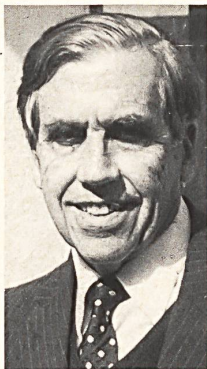
Hans Robert Weisbrod Präsident der Europäischen Kommission für Seidenpropaganda

Rückblende Die Entwicklung der Seidenindustrie ist vor allem unter dem Aspekt zu betrachten, dass 80-85 % der Weltproduktion von ca. 45 000 Tonnen für Nationalkostüme Verwendung findet (Sarıs, Tunikas, Kimonos usw.). Damit steht fest, dass besonders der asiatische und afrikanische Raum zu den grössten Abnehmern zählt.