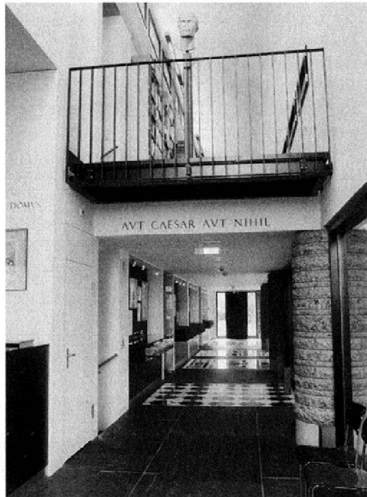
Abb. 2: Eingangsbereich mit Galerie und Ausstellungsraum der Bibliothek Werner Oechslin.

Mit der Replik des Laokoon sowie den zahlreichen Stichen und Inschriften wird im Lesesaal die Metapher des Weges fortgesetzt. Das Ensemble von Wissen und Raum, durch welches sich das Narrativ der Irrfahrten der Helden aus dem trojanischen Zyklus und Vergils Aeneas schlängelt, verweist (wie Oechslin auf seinen Führungen stets zu betonen pflegt) auf den langen bisweilen verworrenen Bildungsweg des Menschen. Die Bibliothek als Sinnbild des universellen Wissens und ihre Überblendung mit den Heldenepen Homers und Vergils stellt jedoch keineswegs eine Neuschöpfung Oechslins dar. Der Jesuit Claude Clemens schrieb in seinem Klassiker zur Bibliotheks- und Sammlungstheorie von 1635, dass der besondere Nutzen der Bibliothek in der Möglichkeit des vergleichenden Wissenserwerbs (« comparenda eruditio ») bestünde. Ebenso wie die Krieger im Bauch des trojanischen Pferdes, so fährt Clemens fort, strömt aus der Bibliothek das gesamte Wissen aller Gelehrten und Schriftsteller hervor. 9