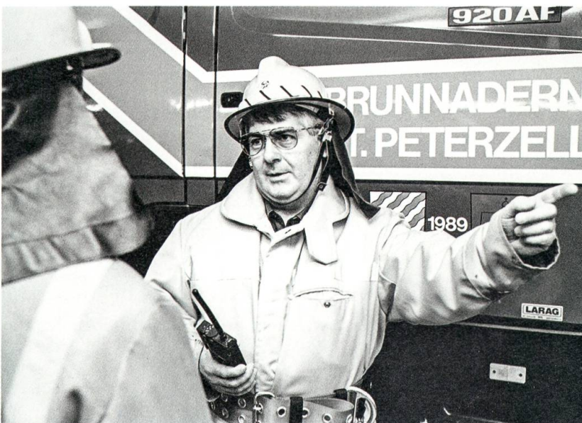
Der Kommandant und Instruktor der Feuerwehr, 1991.

sident der Wasserkorporation Brunnadern, Liegenschaftsverwalter der Katholischen Kirchgemeinde St. Peterzell, Baukontrolleur sowie Kassier der Sekundarschule Oberes Neckertal und bis 2009 Präsident des Vereins Soziale Fachstellen Toggenburg.