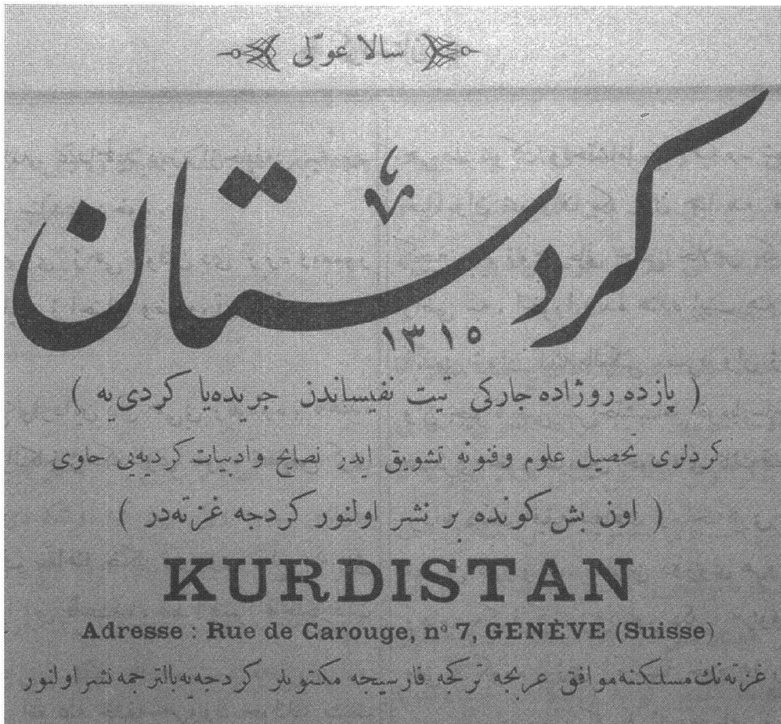
Abbildung 2. Die erste kurdischsprachige Zeitschrift ( Kurdistan ) und ihre Genfer Adresse.

sich nicht mit dem Gewissen des noch jungen Türken, der ich bin. Ich bin von einigen Seiten dazu ermuntert wurden, nach Genf zu gehen, wo man mit drei Liren im Monat leben kann.» 17