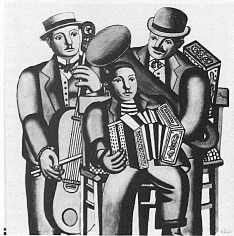
Fernand Léger: Les trois musiciens