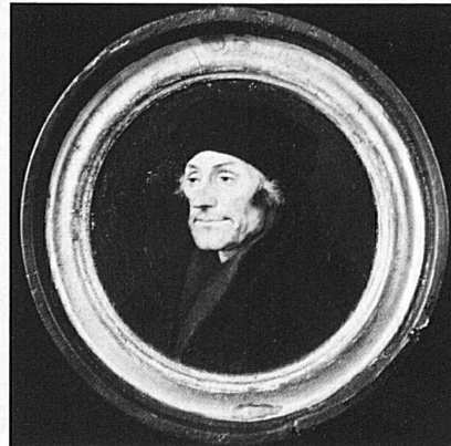
Bildnis des Erasmus, von Hans Holbein d. J., um 1532

In der modern konzipierten Ausstellung werden die Person des Erasmus, seine Umgebung und die Zeit, in der er lebte, lebendig vorgestellt.