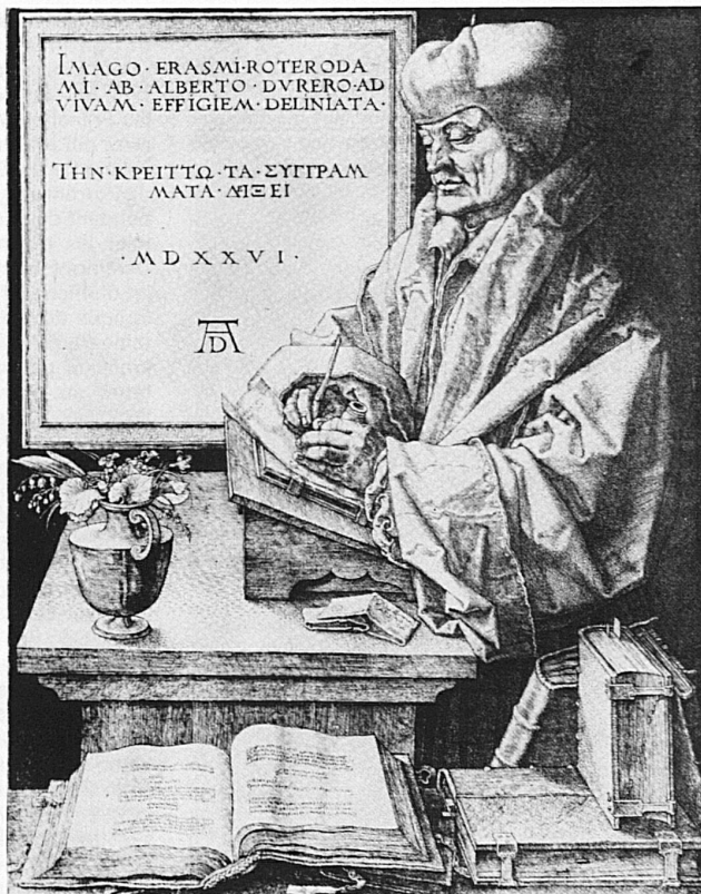
Bildnis des schreibenden Erasmus