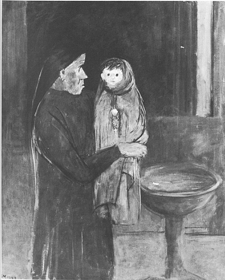
Ernst Morgenthaler (1887–1962): In der Kirche (Orselina) A l'église (Orselina)

C'est le 30 avril qu'Armin Meili fête son 80 e anniversaire. Le chemin qu'il a parcouru durant sa brillante carrière, on peut le résumer en quelques mots: d'une exposition nationale – à l'intérieur – à la présence nationale – hors des frontières. La même formule définit également les aspirations de son successeur à la tête de l'ONST depuis le 1 er mai 1963: le président Gabriel Despland, ancien conseiller aux Etats. Avec lui, la direction et tous les collaborateurs de l'Office national suisse du tourisme adressent à Armin Meili leurs meilleurs vœux d'anniversaire, en lui exprimant leur reconnaissance pour l'œuvre accomplie au service du pays et de son tourisme.