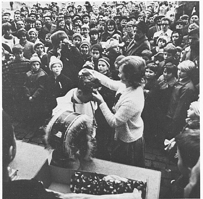
Die Krönung der Sieger. Im Vordergrund eine Kuhshelle als Wanderpreis ▲ Le couronnement des vainqueurs. Au premier plan: la grosse sonnaile: récompense que le gagnant transmet à celui de l'année suivante Premiazione dei vincitori. In primo piano, un campanaccio, premio itinerante Crowning the winners. In the foreground the challenge trophy: a cow-bell

Junger «Geislechlepfer» beim Training Jeune garçon s'entraînant au jeu du «Geislechlepfe» Addestramento nel maneggio della frusta A young "whiperacker" in training