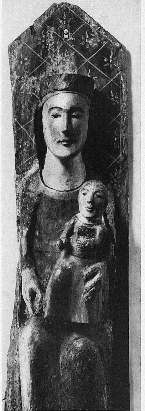
Madonna in trono (probabilmente fine del XII sec.). Riproduce, in forma semplificata, un modello romanico corrente