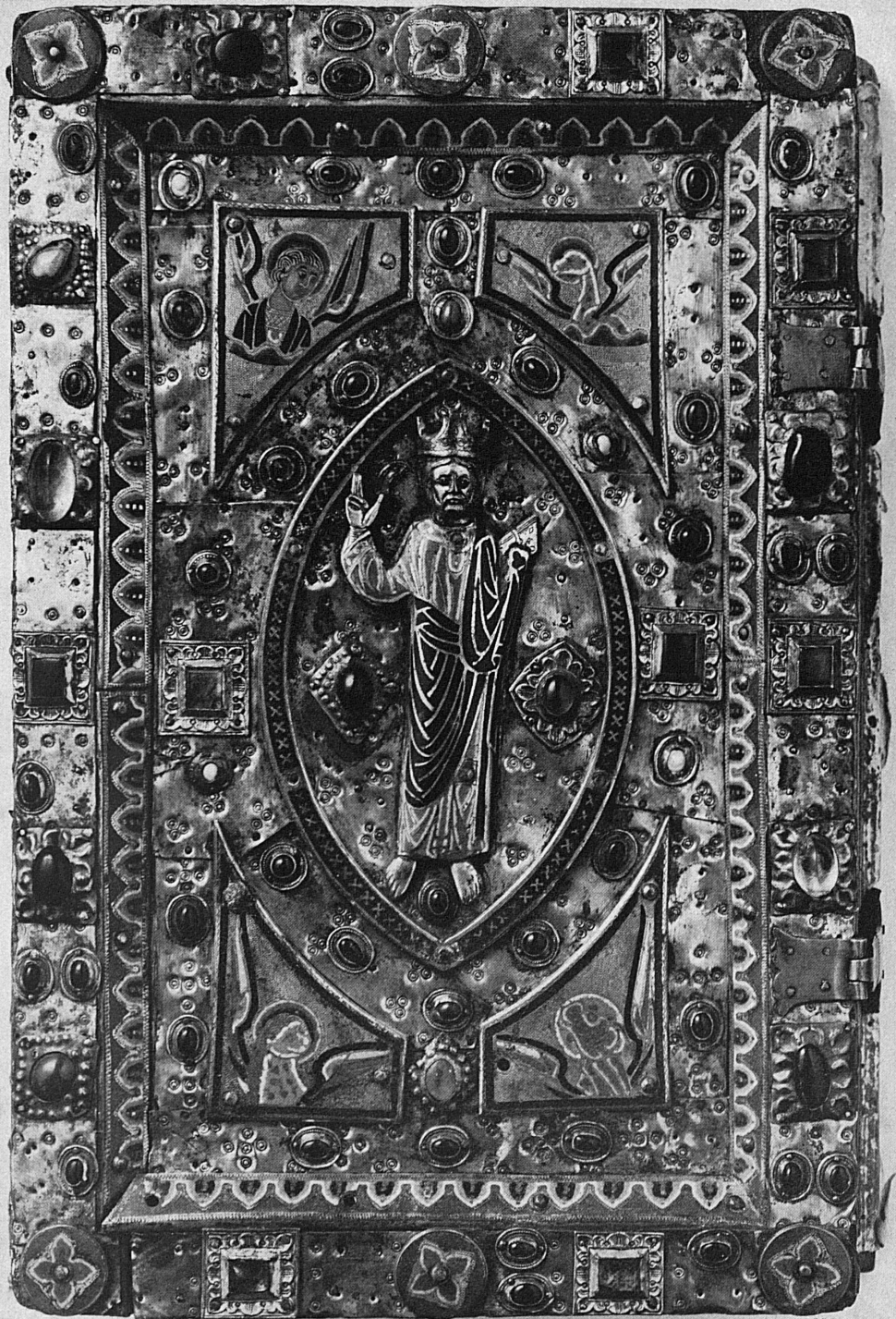
Codex somptueux en cuivre doré, avec pierres précieuses et émail cloisonné limousin. Dans la mandorla Jésus-Christ. Vers 1200. Provenant du Monastère de Rheinau (canton de Zurich)