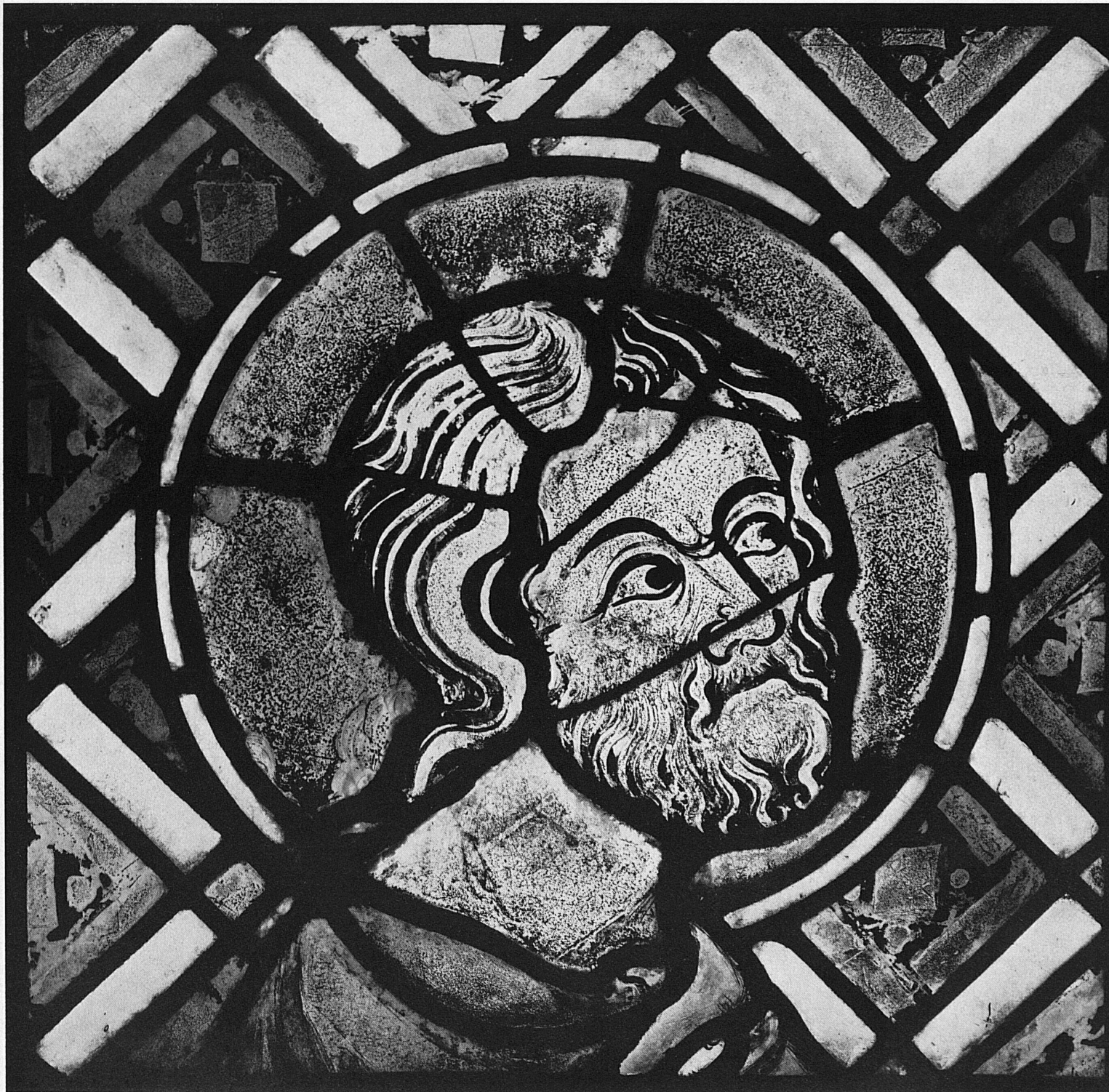
Apostelkopf, um 1340. Fragment aus einem Chorfenster der Zisterzienserabtei Hauterive (Freiburg)

Tête d'apôtre. Fragment d'un vitrail du chœur de l'église de l'abbaye cistercienne de Hauterive (Fribourg)