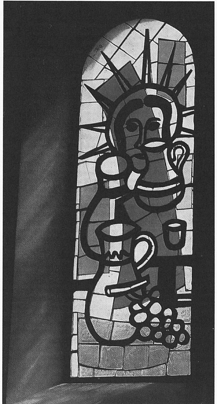
Fernand Léger (1881–1955): Die Hochzeit von Kana. Kirche von Courfaivre, 1954 • Les noces de Cana, vitrail de Fernand Léger (1881–1955) à Courfaivre, 1954.

Nicodemus as a helper at the Burial of Christ. His features betray agitation and sorrow, yet moderated by his knowledge of salvation. Two reds, the gentian blue of the background and white all seem heightened in intensity by their contrast