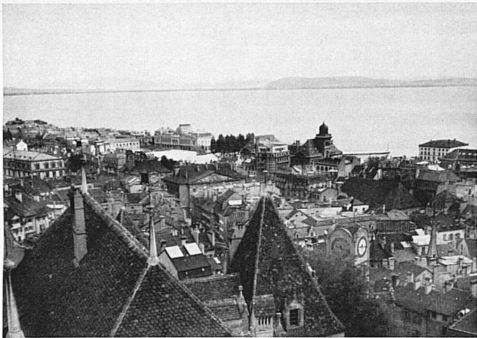
La ville, vue du château. Blick vom Schloß aus über die Stadt.

La pittoresque maison du Trésor, dans la vieille ville de Neuchâtel, a été récemment restaurée avec beaucoup de goût. Les boutiques du rez-de-chaussée ont été ornées de charmantes enseignes de fer forgé.